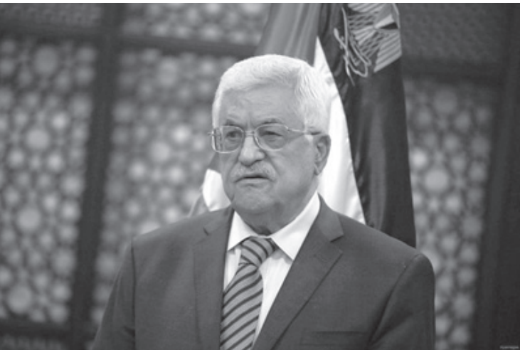
الأنباط - عمر كلاب

الانتظار والاستعداد، فما سبق لن يعود، قاصدًا مساحة المناورة والحركة السابقة للدبلوماسية الأردنية. الوحيد الذي يبحث عن ترياق، هو رئيس السلطة، الذي سيكون آخر من يحظى بهذه التسمية، حسب مجريات الأمور، ورغم أن هذا المخطط خطير للغاية، إلا أنه لم يجد حتى اللحظة الكثير، من التصريحات والمواقف الفلسطينية، خاصة من قبل السلطة في رام الله، لمواجهة وحتى الدعوة إلى دور عربي وإسلامي للتصدي له، نظرًا لما يحمله من مخاطر تهدد الفلسطينيين بشكل مباشر، مما يعني أن السلطة تدرك أنها خارج الحسابات