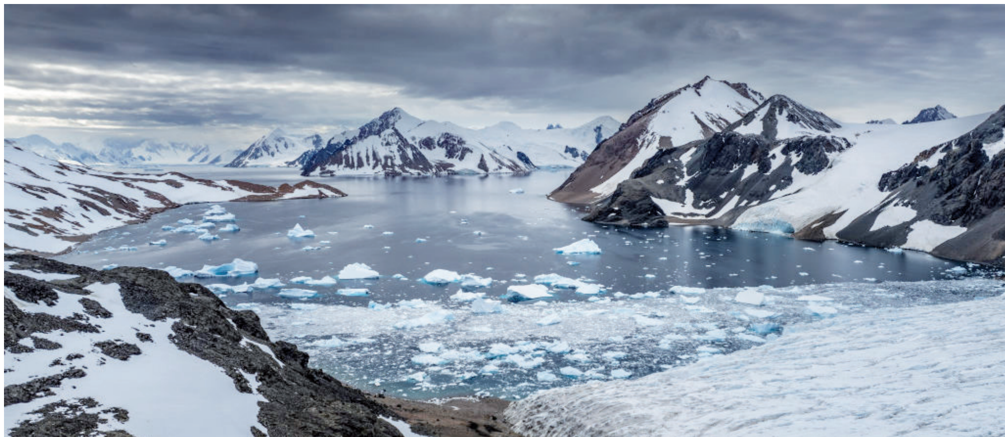
الأنباط - وكالات

"كتلة جليدية بمساحة ألمانيا ويسمك ٢٥ مترًا..