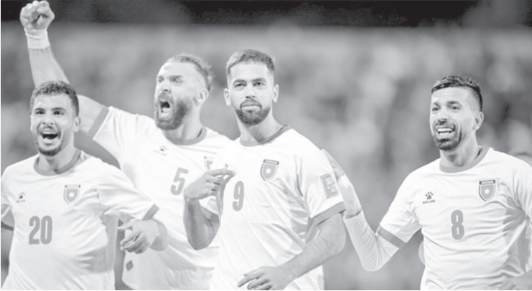
الانبساط - عمان

يرفع نجوم منتخبنا الوطني لكرة القدم شعار الفوز ولا يدل على الهزيمة للمنظرة التي تجمع النشأى مع المنتخب الفلسطيني الشقيق عند الساعة ٩:١٥ من مساء اليوم الخميس على استاد عمان الدولي، ضمن مشواره بمنافسات الدور الثالث والحاسم من تصفيات كأس العالم ٢٠٢٦ ذلك ان الفوز وحده يخلصه من حظوظ منتخبنا بالمنافسة على احدى بطاقي التأهل المباشر الى نهائيات كأس العالم وتمنح النشأى לעنويات العالية في اللقاء القادم امام منتخب كوريا الجنوبية على ارض الاخير مساء الثلاثاء ..ويسمى جومنا الكبير استامال الحضور الجماهيري الكبير لمتوقع ان يواكب المباراة من مدرجات استاد عمان لبث الحماس في نفوس النشأى الذين استعدوا جيدا لهذا اللقاء من خلال المستدرك التدريب الذي قام به المنتخب في عمان والذي تخلله لقاء ودي امام منتخب كوريا الشمالية انتهى