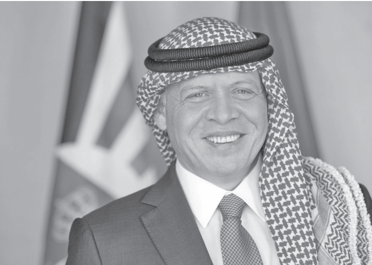
الانباط-عمان إلى أرض الوطن، امس الأربعاء، بعد زيارتي عمل إلى إيطاليا وفرنسا. عاد جلالة الملك عبدالله الثاني