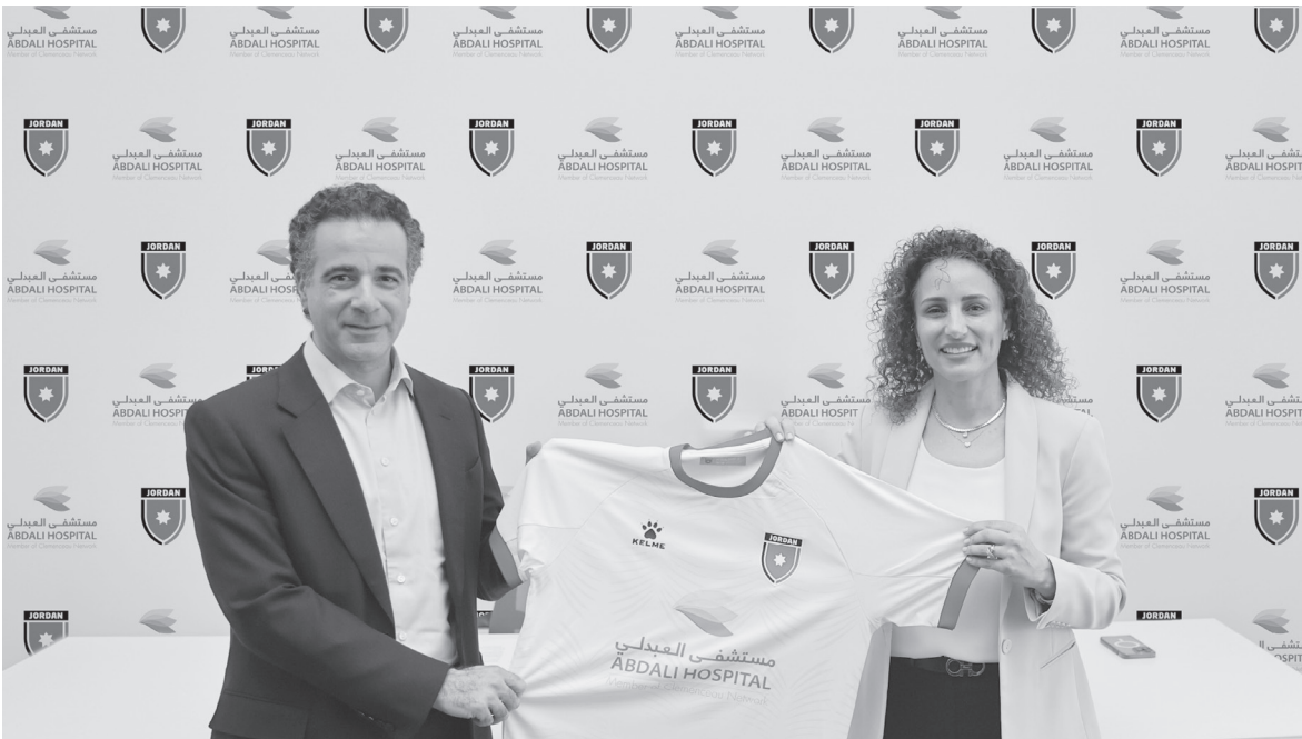
الانبساط - عمان