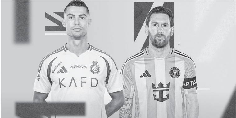
الارجنتين - وكالات

أصبح غياب الأرجنتيني ليونيل ميسي (٢٧ عاما) عن المباريات مؤخرا، أمرا معتادا، سواء مع فريقه أتلتيكو مدريد الإسباني أو منتخب بلاده، حامل لقب كأس العالم. وفي بداية فترة التوقف الدولي الحالية، أعلن أسطورة كرة القدم غيابه عن معسكر الأرجنتين، بسبب معاناته من إصابة بسيطة. ويستعد المنتخب الأرجنتيني لحوض مباراتين مهمتين في تصفيات كأس العالم ٢٠٢٦، حيث سيلقي بأوروغواي والبرازيل يومين ٢٦ و٢٧ مارس/آذار الجاري. ويعبر حسابه بوقوع التوصل