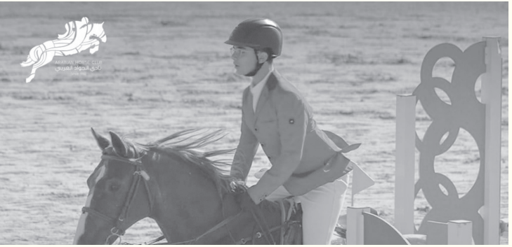
الانبطاط - عمان