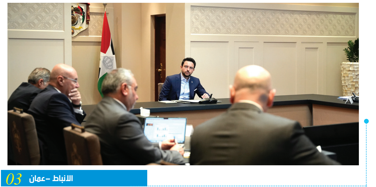
الانباط - عمان 03

ترأس اجتماعات لبحث استراتيجيات تطوير القطاع السياحي نائب الملك يؤكد أهمية وضع خطة عمل لقطاع السياحة في الفترة المقبلة