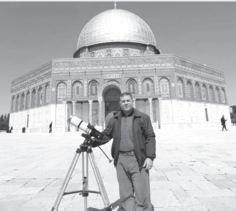
الأنباط - آلاف تيسير

يتجدد الجدل كل عام مع اقتراب نهاية شهر رمضان المبارك لعام ١٤٤٦هـ، حيث يترقب العالم الإسلامي تحري هلال شهر شوال، الذي يحدد موعد عيد الفطر ويتجدد الجدل الفلكي والشرعي حول إمكانية رؤية الهلال، بين من يعتمد على التلسكوبات والتقنيات الحديثة، ومن يلتزم بالرؤية الشرعية بالعين المجردة.