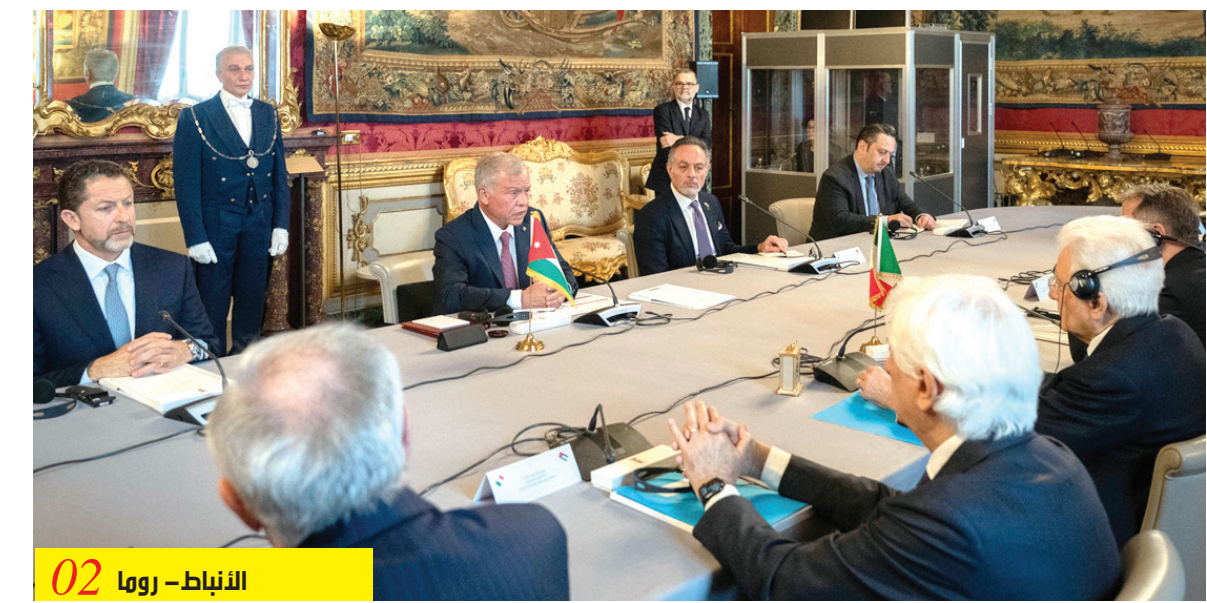
الانباط - روما 02