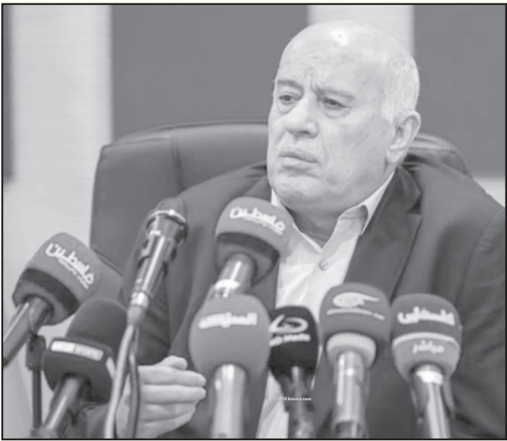
رام الله - وكالات

«كان اليفا ينتظر رسالة مشتركة منا والاتحاد العراقي للموافقة على اللعب في فلسطين، لكن لم نتلق أي رد على اتصالاتنا من الاتحاد العراقي». وأضاف: «لم يكن لدينا مانع من اللعب في البصرة، لو كان هناك تعاون معنا من قبل الاتحاد العراقي». وبين أن «اختيار ملعب عمان الدولي جاء وفقاً لما يخدم مصلحة منتخبنا الوطني أولاً، وواصل: «لقاء منتخبنا أمام نظيره العماني في يونيو/حزيران القادم سيكون على أرض فلسطين، ونتمنى أن يمتلك الاتحاد العماني الإرادة للعب على أرضنا».