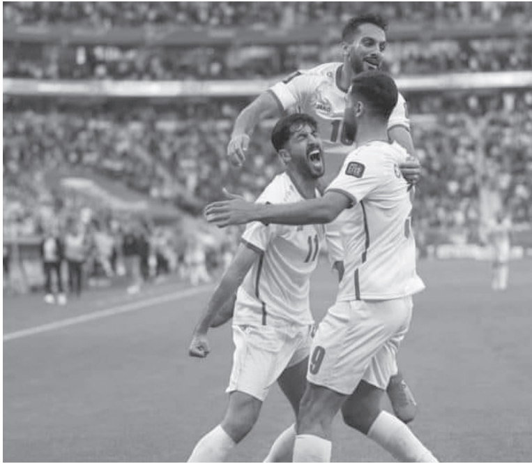
نقاط. ويرى الجمهور الأردني أن الفرصة إيجابية أمام فلسطين وكوريا

ويحتل المنتخب الوطني المركز الثالث في المجموعة الثانية برصيد ٩ نقاط، خلف منتخب كوريا الجنوبية ١٤ نقطة، والعراق ١١ نقطة، فيما يحتل منتخب سلطنة عمان المركز الرابع برصيد ٦ نقاط، والكويت ٤ نقاط، وفلسطين ٣