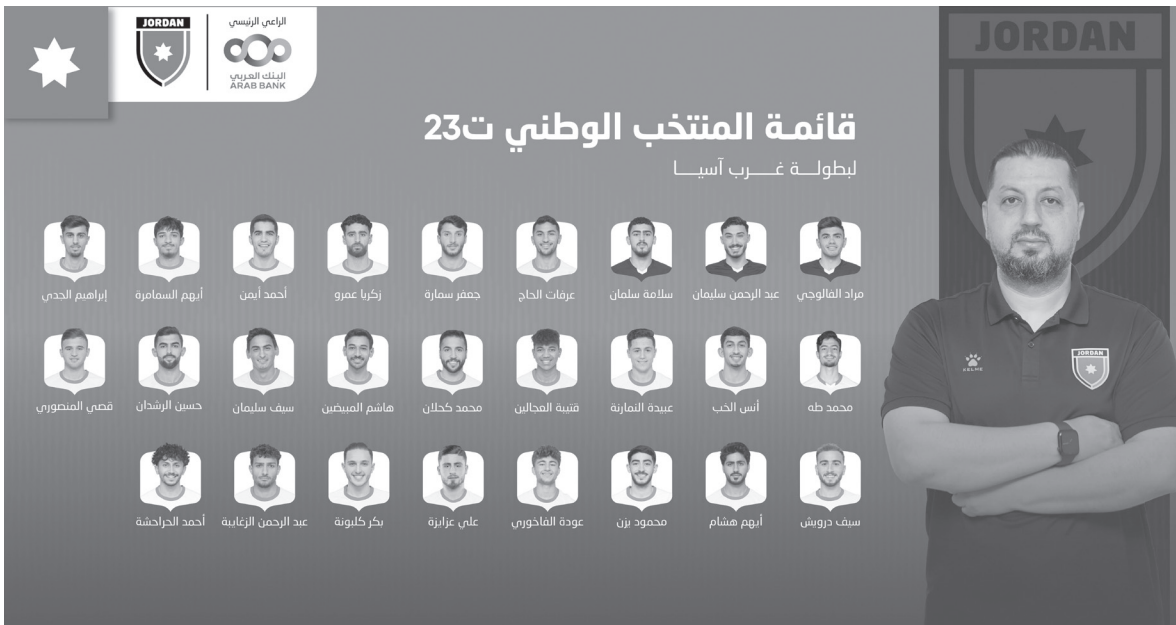
الانباط - عمان

نصف النهائي، ثم المباراة النهائية، فيما يلعب الفريق الخاسر مواجهات أخرى لتحديد باقي المراكز. وتأتي البطولة في إطار التحضيرات للمشاركة في التصنيفات الآسيوية مطلع أيلول.