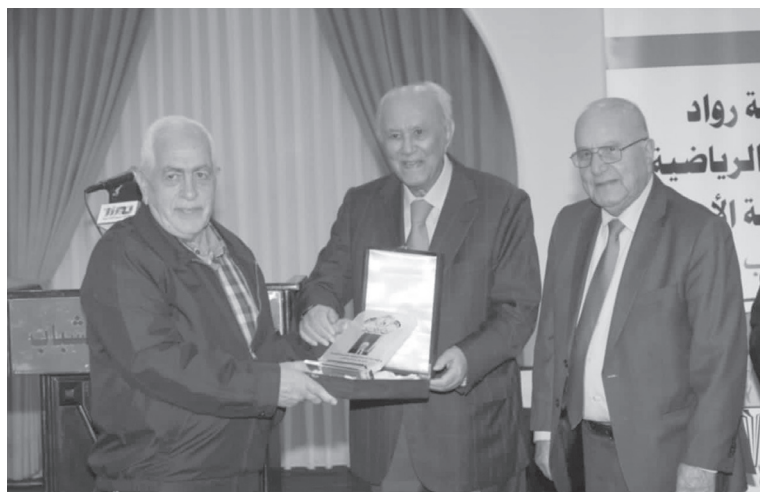
الانباط - عمان

من توفاهم الله من أعضاء الهيئة. وأكد الطبيب ان الحفل فرصة للقاء العشرات من رواد الحركة الرياضية