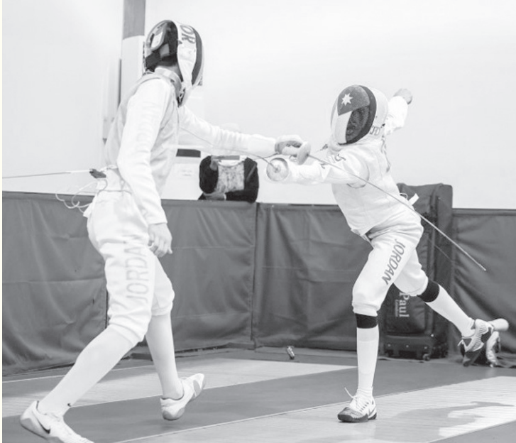
الانباط - عمان

في أسلحة المبارزة الثلاث. ويأتي تنظيم الاتحاد الأردني للمبارزة لهذا الدوري لزيادة التنافس بين اللاعبين واللاعبات ومنحهم فرصة الاحتكاك المستمر ضمن أجواء تنافسية تمهيداً لضم أصحاب أفضل النتائج في نهاية منافسات الدوري إلى تشكيلة المنتخبات الوطنية.