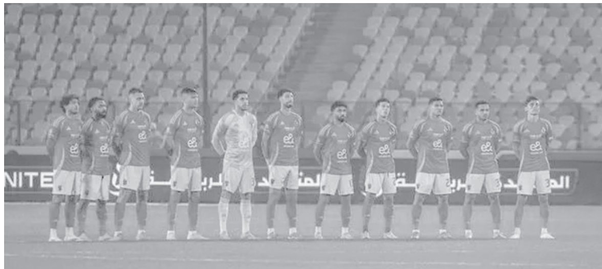
القاهرة - وكالات

وأعلن الأهلي بشكل رسمي رفضه خوض المباراة إلا في حالة تعيين طاقم تحكيم أجنيبي، ما دفع رابطة الأندية لاعتبار النادي خاسراً بنتيجة ٣-٠.