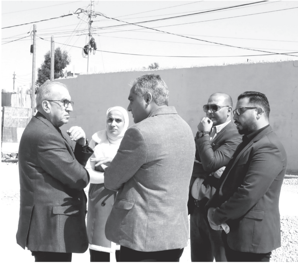
م لتحقيق مسارب تسارع وتباطؤ مناسبه للقادم من جهة الزرقاء وتفتيد عبارة أنبوبية بحمايات خرسانية أسفل المنطقة التوسعة للحفاظ على مسار ومنسوب قناة مياه الامطار القائمة.

تفقد وزير الأشغال العامة والإسكان المهندس ماهر أبو السمن، أمس الاثنين، أعمال مشروع إنشاء الطريق التمهوي لمنطقة وادي العش الصناعية وطرق الربط للمنطقة مع طريق عمان التنموي. وأكد أبو السمن خلال جولة ميدانية في المشروع ضرورة تسريع وتيرة الأعمال لتنفيذ المشروع ضمن المدة المحددة، ووفق أفضل المواصفات العالية. ولفت إلى أهمية الطريق لخدمات القطاعات الاقتصادية وخصوصاً المنشآت الصناعية القائمة في المنطقة والتي توفر العديد من فرص العمل وتُشغل الكثير من القطاعات المرتبطة والمساندة. يشار إلى أن طول المشروع يبلغ ١,٢ كم، ويتضمن تحسين المسار والمنحنيات الأفقية والعمودية، لربط منطقة وادي العش الصناعية - الزرقاء بطريق عمان التنموي لخدمة جميع الحركات المرورية من وإلى المنطقة وبجميع الاتجاهات، وتنفيذ تقاطعين على نفس المنسوب (دوار) واستخدام الجسر الخرساني القائم على الطريق (طريق عمان التنموي) لإضافة حركة مرورية جديدة خدمة لسير المتجه من الطريق التنموي ومنطقة وادي العش إلى مدينة عمان.. و يشمل العمل إعادة إنشاء وتحسين وتوسعة الطريق القائم باتجاه الجسر وأعمال إنشاء تقاطعين على نفس المنسوب (دوار)، وإنشاء طريقين للربط بطريق عمان التنموي والجسر القائم من جهة القادم باتجاه العاصمة عمان مع توفير الربط الملائم ومسارب تسارع وتباطؤ، وتزويد الموقع بعناصر السلامة المرورية كافة. كما يشمل العمل كشط وإعادة تعبيد أجزاء من طريق عمان التنموي وتسوته بطول ٢٥٠ م تقريبا ويعرض ٤