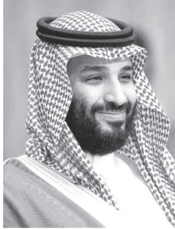
الموقف التركي، وبالتالي يكون الاقتراب، على قاعدة الاستفادة من إمكانات الدولة التركية، التي تعيد ترتيب أوراق علاقاتها، مع محور الأردن العربي، مصر والسعودية، وبالتالي لا يوجد

حساسية سعودية أو مصرية من الاقتراب منها، والجميع يريد أن يرى سورية موحدة، وليست لقمعة مقسمة بين أضلاع مثلت الضعالية على الأرض السورية، طهران وتل أبيب وأنقرة. الأردن بالضرورة ضد المشروع الصهيوني في سورية، الذي يريد دويلات سورية أو على الأقل ميوعة جغرافية وديمقراطية في سورية، كذلك طهران ومشروعها الذي حول الصداق في الرأس الأردنية إلى طنين دائم، بتهدية أسلحة ومخدرات وعبث اجتماعي وسياسي، ويضيق المشروع التركي هو الأكثر مقبولية في الأردن، بعيداً عن تهويلات العثمانيين وتدابيرها، فالأردن يدرك أن تركيا دولة محورية في الإقليم وتريد أن تحتل مكانها بعد تراجع محور طهران، ومصصلحة الأردن أن يكون المحور التركي قوي لمواجهة المحور الصهيوني. تركيا لديها علاقة حميمة مع حماس الحركة التي تقاوض واشنطن اليوم، ولها تأثير ونفوذ متزايد في الضفة الغربية، الذي يمتلك الأردن حساسية عالية لأي خطة وتغيير في الديموقراطية أو الجغرافيا هناك، وحماس قادرة على منع ارتفاع الحساسية هناك، وتركيا تحتاج الأردن لعلاقتها مع أبناء محافظتي درعا والسويداء، وتحتاجه مع الأكراد أيضاً، فكل هذه العلاقات الطيبة محلياً والتضحية خارجياً، تجعل من العلاقة الأردنية التركية متوازنة إلى حد ما، في ظل دعم مصري-سعودي. الدبلوماسية الأردنية تكسر النموذج المألوف من عدم التدخل في الجوار، بعد أن بات الجوار يلقي بظلاله على المشهد المحلي، ولا يمكن إدارة الظهر له، بل يجب مواجهته على أرضه وليس على الأرض الأردنية، لذلك كان الفريق الأمني وعسكري وسياسي، لقيادة الدور الأردني مع الصديق التركي.