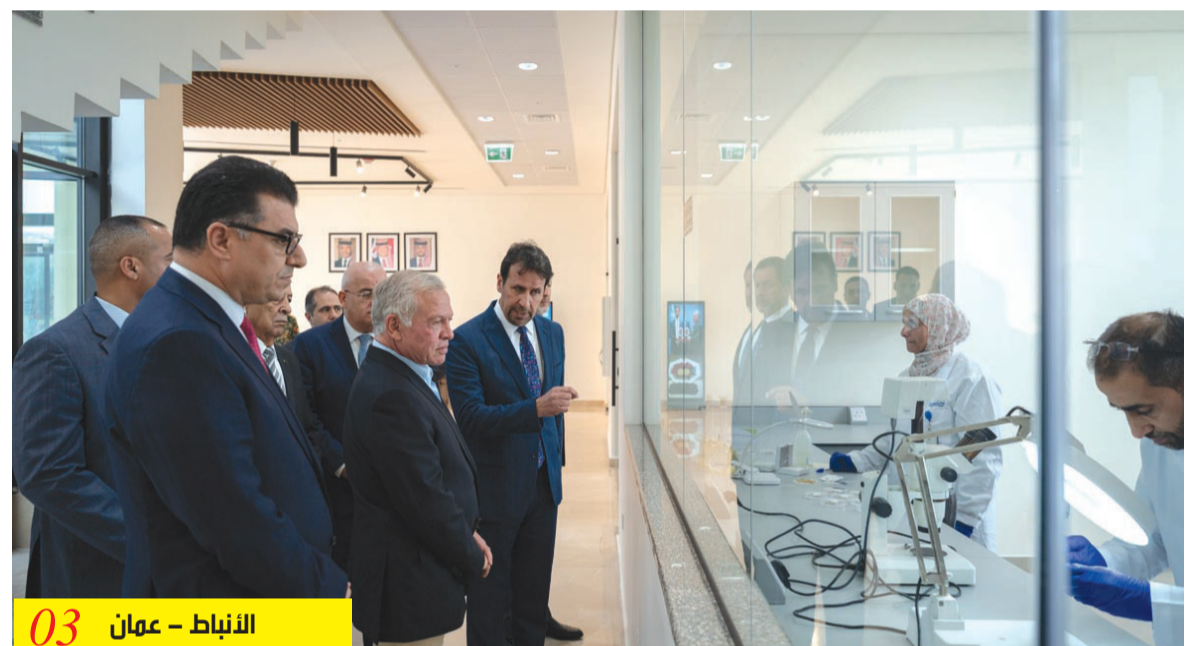
03 | الأنباط - عمان

فريق سياسي عسكري أهني لضرب الخطر على أرضه وليس على أرضنا