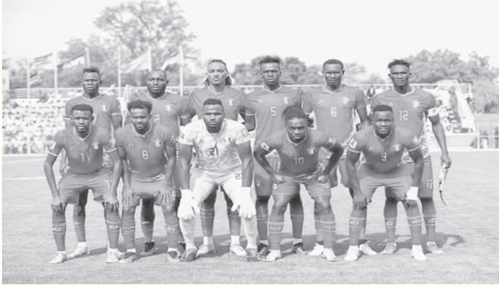
السودان - وكالات

العالم ٢٠٢٦. ويقيم صفور الجديان معسكراً تحضيرياً بالملكة العربية السعودية بمدينة الطائف لمدة ١٢ يوماً، بعدها يحل المنتخب ضيفاً على الأردن في مباراة ودية مع النشامى، ومنها يتوجه إلى دولة ليبيا يوم ١٧ من الشهر نفسه. واستدعى مدرب السودان كواسي أبياء، تشكيلاً يجمع بين العناصر المحلية والمحترفين الدوليين، يتكون من ١٠ لاعبين من نادي الهلال، ١٠ لاعبين من المريخ، كما تم استدعاء عدد من المحترفين السودانيين، من الدوري الأسترالي.