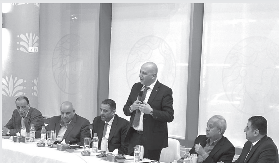
الأنباط - أربد

قال وزير الاستثمار المهندس منى الغرايبة، إن الوزارة تعمل على خطة متكاملة لتبسيط الإجراءات على المستثمرين، بالتنسيق مع وزارات الصناعة والتجارة والتموين، والتخطيط والتعاون الدولي، الاقتصاد الرقمي والريادة، وغرف الصناعة.