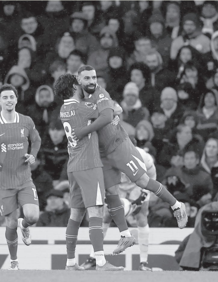
الرياض - وكالات

«الهلال» بات مهتماً بالتعاقد مع سوبوسلاي، مؤكداً أن بطل دوري روشن الموسم الماضي برصيد ١٢٠ مليون يورو من أجل التعاقد مع اللاعب. وأضاف التقرير نقلاً عن موقع «Fichajes»، الإسباني أن سوبوسلاي بات عنصراً مهماً في تشكيلة المدرب أرنه سولوت، وأن فكرة رحيله عن أنفيلد في الصيف المقبل قد لا تكون مرجحة، غير أن المبلغ الكبير الذي يرصده الهلال قد يغري ليفربول للموافقة على رحيل نجمه.