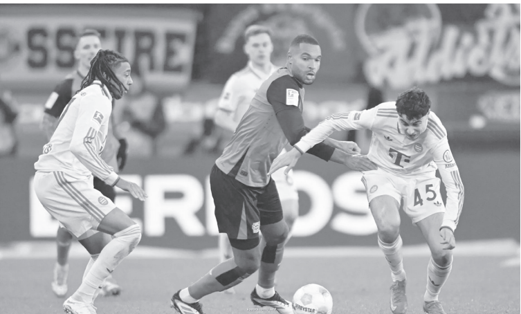
برلين - وكالات

الموسم. ويملك البايرن أقوى خط هجوم برصيد ٧٢ هدفاً وأقوى خط دفاع باستقبال ٢٠ هدفاً، وهو أكثر فرق البوندسليجا تسديداً (٤٤٩) ويملك أعلى معدل لنسبة الاستحواذ على الكرة (٦٤٪)، ومنذ الخسارة أمام ماينز في الجولة ١٤ لم يخسر البايرن في آخر ١٠ مباريات في الدوري. سجل ليفركوزن ١٦ لاعباً