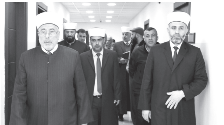
الأنباط – عمان

تفقد سماحة قاضي القضاة، عبد الحافظ الربطة، أمس الأحد، سير العمل في مجمع محاكم صويلح الابتدائية الشرعية، تنفيذاً للتوجيهات الملكية السامية بتعزيز التواصل الميداني المباشر. وتأتي الزيارة ضمن جولات تفقدية تشمل جميع المحاكم الشرعية، للاطلاع على سير العمليات اليومية والخدمات المقدمة للمواطنين، وحل المشكلات والتحديات التي تواجه هذه المحاكم. وأعرب سماحته عن تقديره الكبير لجهود الكادر القضائي والإداري في المجمع، داعياً إياهم إلى الاستمرار في تقديم خدماتهم وفق أفضل الممارسات القضائية. وأطلع الربطة، يرافقه مدير المحاكم الشرعية، القاضي الدكتور سميح الزعبي، على سير الإجراءات الإدارية والقضائية، مؤكداً ضرورة تبسيط الإجراءات وتسهيلها، وتقصير أمد التقاضي، بما يضمن تحقيق العدالة الناجزة. كما تابع سير الخدمات الرقمية التي أطلقتها دائرة قاضي القضاة أخيراً، مشيراً إلى أهمية التحول الرقمي في جميع أعمال الدائرة والمحاكم الشرعية، بهدف تسريع الإجراءات وتقديم الخدمات الفضلى للمواطنين والمتعاملين، بما يحقق أهداف خطة التحول الرقمي لهذه الدائرة، وينسجم مع التوجه الوطني نحو التحول الرقمي في الإجراءات القضائية.