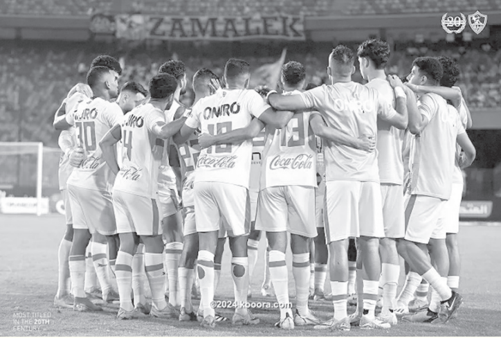
القاهرة - وكالات

التحكيم في الدوري المصري، موضحاً أن الاتحاد المصري لكرة القدم وعد بتطوير منظومة التحكيم، ولكن الأمر تسير للأسوأ. وأوضح أن الانسحاب من لقاء القمة أمام الأهلي بالدوري المصري خلال منافسات الموسم الماضي، لم يكن خطأ لأن المنظومة تم إصلاح أمور بها على رأسها انتظام المسابقة، واعترف شكرى بأن هناك أخطاء غير متعمدة داخل مجلس الزمالك، ومن بينها طريقة إدارة الصفقات قبل تعيين لجنة للتخطيط.