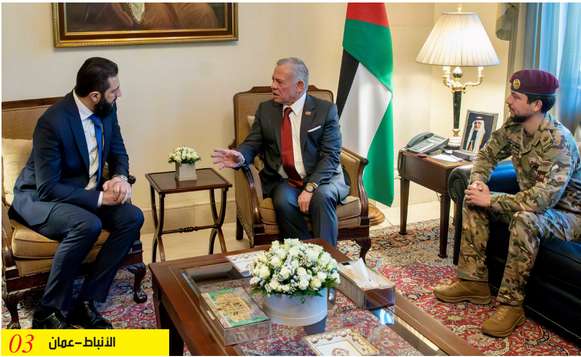
الأنباط - عمان 03

ادان الاعتداءات الإسرائيلية على الأراضي السورية واكد دعم سيادة سوريا ووحدتها