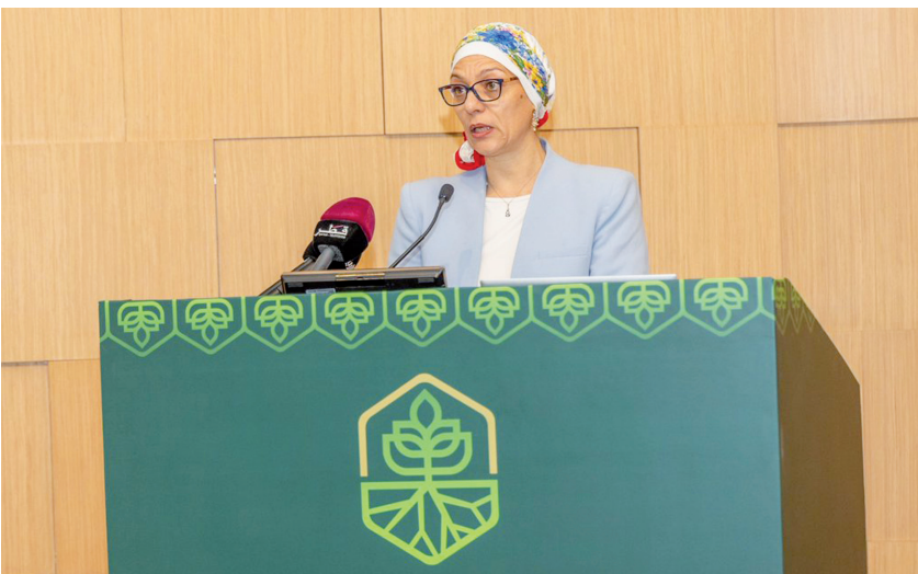
الانباط - الدوحة

شاركت سمو الأميرة بسمة بنت علي، مؤسس الحديقة النباتية الملكية، في الجلسة الختامية للمنتدى الدولي الثالث لحديقة القرآن النباتية الذي اختتم الليلة الماضية في الدوحة بعنوان ” دور الصون النباتي في تعزيز التنوع الحيوي والحفاظ على البيئة، وحضرت سمو الأميرة بسمة بنت علي أعمال المنتدى كضيفة شرف، إلى جانب وزير البيئة والتغير المناخي القطري الدكتور عبدالله بن عبد العزيز السبيعي، فيما شارك في المنتدى نخبة من الخبراء والمتخصصين من داخل قطر وخارجها.