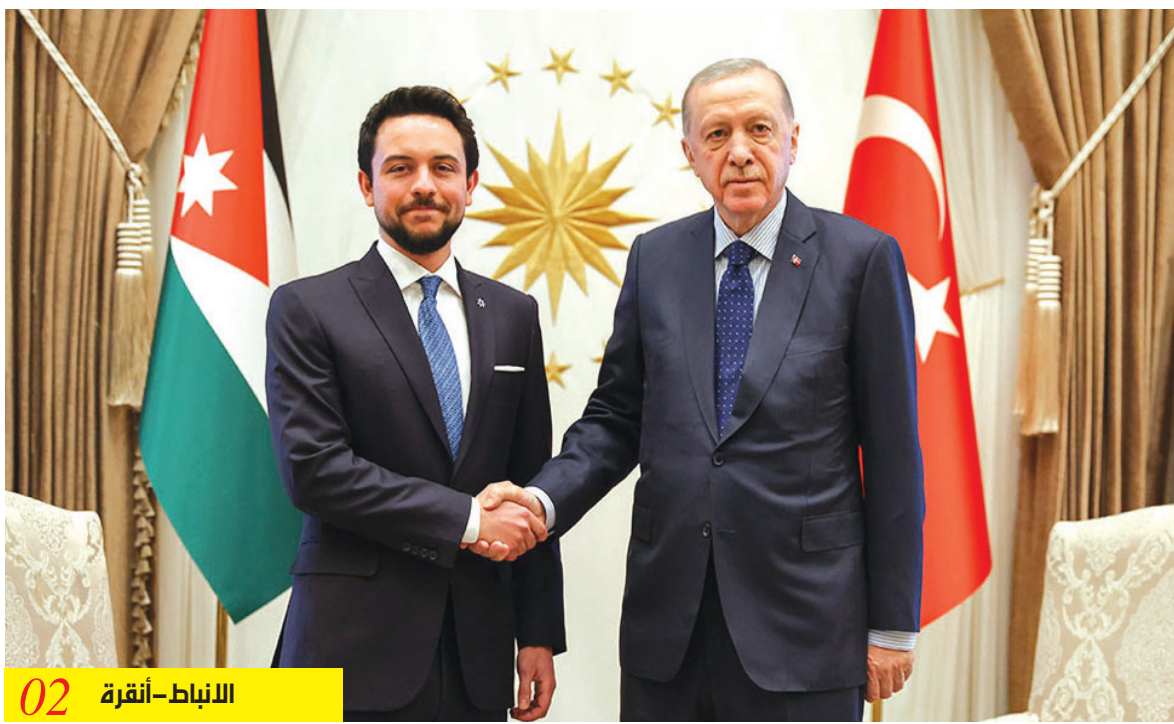
الأنباط - أنقرة 02

الملكة رانيا العبدالله تلقتي سيدات لواء القويرة وتطلع على مشاريع مدرّة للدخل في المنطقة