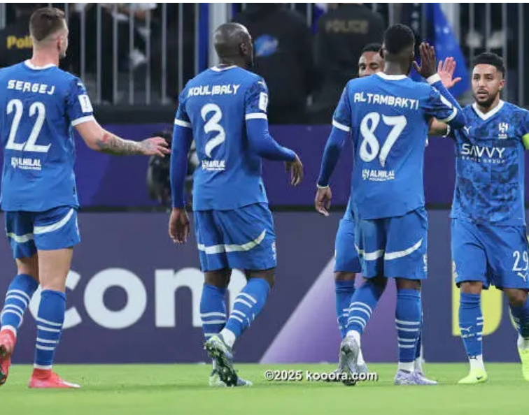
الرياض - وكالات

في مرحلة الدوري، إضافة إلى ٨٠٠ ألف دولار رسوم المشاركة وإعانة السفر، و٢٠٠ ألف دولار نظير التأهل لثمان النهائي. في المقابل، حصل النصر على ٥٠٠ ألف دولار نظير تحقيق ه انتصارات في مرحلة الدوري، ليكون مجموع ما ناله ١,٥ مليون دولار، بالإضافة المكافآت المالية الثابتة عن التأهل ورسوم المشاركة والسفر. وسيكون بإمكان الأندية الثلاثة، وكذلك باقي أندية ثمن النهائي، الحصول على ٤٠٠ ألف دولار حال التأهل لربع النهائي، و٦٠٠ ألف دولار حال التأهل لنصف النهائي. يذكر أن بطل النخبة سيحصل على ١٠ ملايين دولار، فيما سيحصل صاحب المركز الثاني على ٤ ملايين.