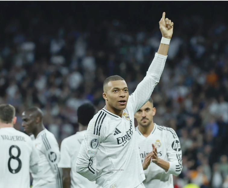
مريد - وكالات

أقوياء جداً على أرضنا، وأسعدنا جميع المديرين.. وبسؤاله هل كانت مباراة مانشستر سيتي الأفضل له في الموسم، أجاب: «لست الشخص المناسب لتحليل ذلك، لكنه كان يوماً رائعاً. علينا الاستمرار بهذا المستوى إذا أردنا الفوز بكل شيء». وعن تغيير عقليته بعد مباراة أتلتيكو بيلباو في الليجا، أوضح: «قلت ذلك سابقاً، لم أت إلى هنا لألعب بشكل سيئ. أريد أن أقدم أداء جيداً، وأصنع حقبة، وأكتب التاريخ. كان علي اللعب بشخصية قوية، وانتهى وقت التأقلم». وتابع: «ليس لدي حد معين للأهداف. إذا استطعت تسجيل المزيد، فهذا رائع، لكن الأهم هو الفوز بالألقاب». وعن المنافس المحتمل في دور ال١٦، بين أتلتيكو مدريد أو باير ليفركوزن، علق قائلا: «الفريقان صعبان، لكنني أفضل مواجهة أتلتيكو لأننا لن نسافر، ونحن نساfer كثيراً بالفعل».