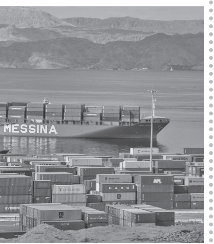
الأنباط – دينا محادين

ثمن الرئيس التنفيذي لشركة ميناء حاويات العقبة هارالد نايهوف توجيه واهتمام جلالة الملك عبدالله الثاني بميناء حاويات العقبة كما ثمن متابعة سمو ولي العهد الأمير الحسين بن عبدالله لسيرة الشركة ما كان له أكبر الأثر في تطوير وتحديث مراقف الشركة وعلى مختلف الصعد.