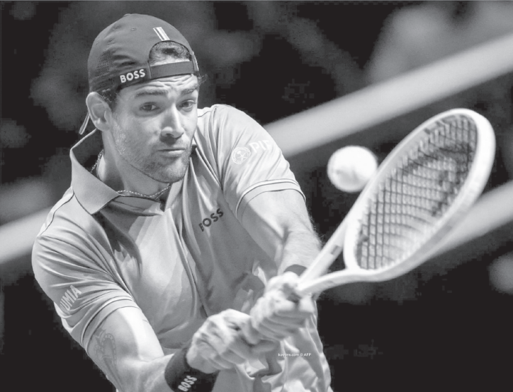
الدوحة - وكالات

ويواجه بيريتيني في الدور الثاني الهولندي تالون جريكسبور، والذي سبق وأن تغلب على الإيطالي في الدور الأول من بطولة روتردام هذا الشهر. وضمن لقاءات الدور الأول أيضاً، تغلب الكندي فيليكس أوجيهه ألباسيم على الفرنسي كوينتين هاليس بمجموعتين مقابل مجموعة واحدة بواقع (٦-٤) و(٤-٦) في غضون ساعتين و٣٤ دقيقة، لينتظر في الدور الثاني الفائز من مباراة اليوناني ستيفانوس تسيتسيباس والصربي هاماد ميديوفيتش.