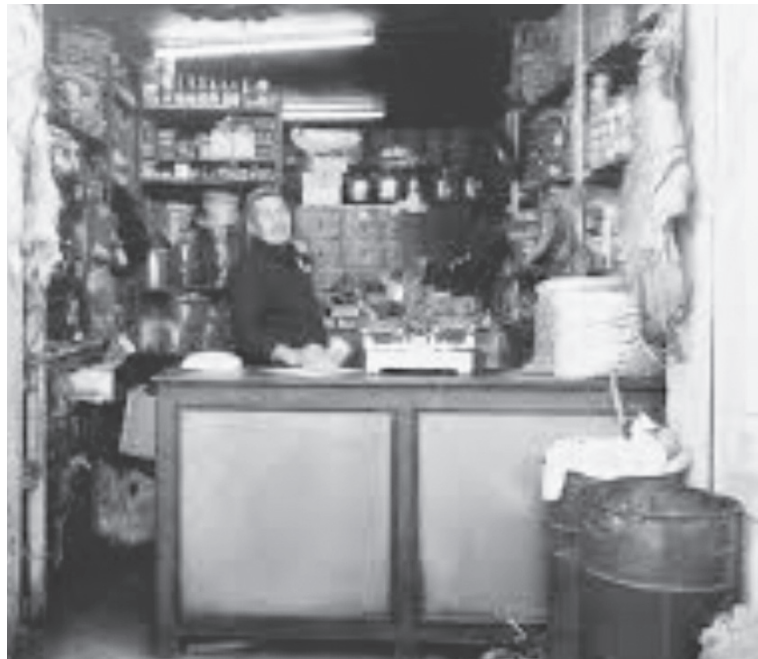
الأنباط - علي سواغنة

س : ما الفرق ما بين الوعي المتصالح والوعي المعذب في كتابك الوعي؟ ج : الوعي الذي يمتلك وسائل السيطرة على واقعه يشعر بالانساق والانسجام والمقدرة، ويتصالح مع نفسه والوعي المأزوم الذي يعجز عن فهم الواقع، أو يرى في تحول الواقع إدانة وتقويضاً لفكرته عنه، بالتالي تكريساً وتأكيذاً لعجزه، ليصبح وعياً معذباً وشقياً. س : ما سبب تأخر البحث العلمي في المجتمعات العربية؟ ج: ضعف استثمارات الحكومات العربية في البحث والتطوير، وهذا يرتبط أيضاً بضعف اهتمامات الحاكمين بالتنمية الاقتصادية والاجتماعية وبمصالح الحكوميين. س : هل لا تزال بعيدين عن دولة المواطنة كما أشرت في كتابك نقد السياسة؟ ج : بالتأكيد، لكن ”بعيدون“ في هذا السياق لا تعني الزمن، لكنها تشير إلى امتلاك وعي واضح وعام بمعنى المواطنة وحكم القانون، وفيما وراء ذلك معنى السياسة وقانونها ووظيفتها. برهان غليون (ولد في ١٣ أيار/ مايو ١٩٤٥)، هو مفكر سوري وأستاذ علم الاجتماع السياسي ومدير مركز دراسات الشرق المعاصر في جامعة السوريون بالعاصمة الفرنسية باريس ورئيس المجلس الوطني السوري السابق. خريج جامعة دمشق بالفلسفة وعلم الاجتماع، دكتور دولة في العلوم الاجتماعية والإنسانية من جامعة السوريون، ولد في مدينة حمص لأسرة عربية، كان يعمل في مجال التدريس قبل أن يهاجر في عام ١٩٦٩ إلى فرنسا، وعاش هناك منذ ذاك الوقت. توجهاته الفكرية قومية عربية تدعو إلى الديمقراطية واحترام حقوق الإنسان وبناء دولة المواطنة العصرية.