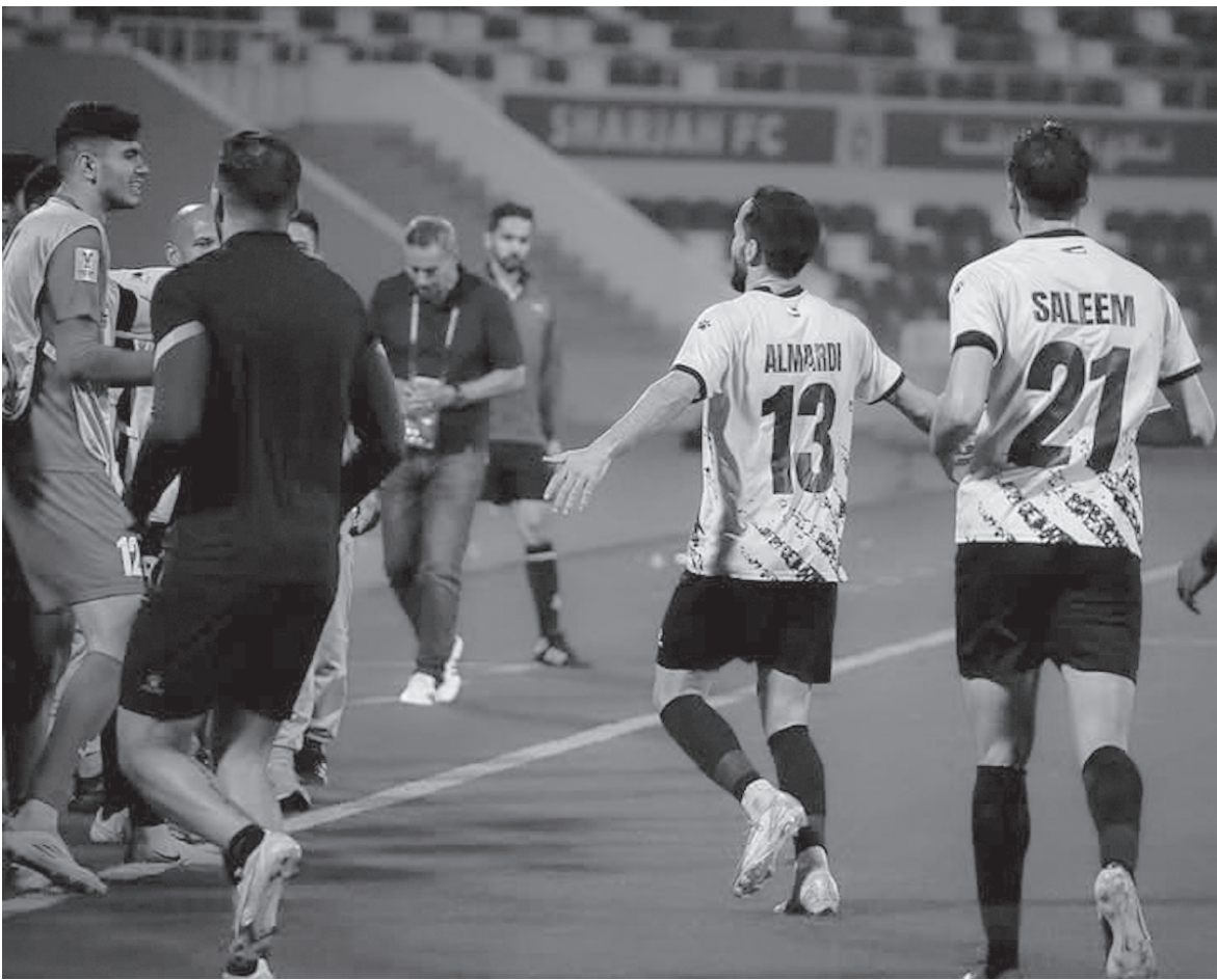
الأنباط—ميناس بني ياسين

أخفق الحسين إربد في استكمال مشواره الآسيوي، بعدما ودّع دوري أبطال آسيا ٢ من دور الـ١٦، إثر خسارته بركلات الترجيح (٣-٠) أمام الشارقة الإماراتي، في اللقاء الذي جمعهما مساء أمس على ستاد الشارقة.