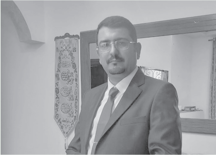
الأنباط - ميناى بنى ياسين / عمر الخطيب

للمناخ يؤكد ضرورة خفض الانبعاثات الكربونية بغض الطرف عن نسبها.