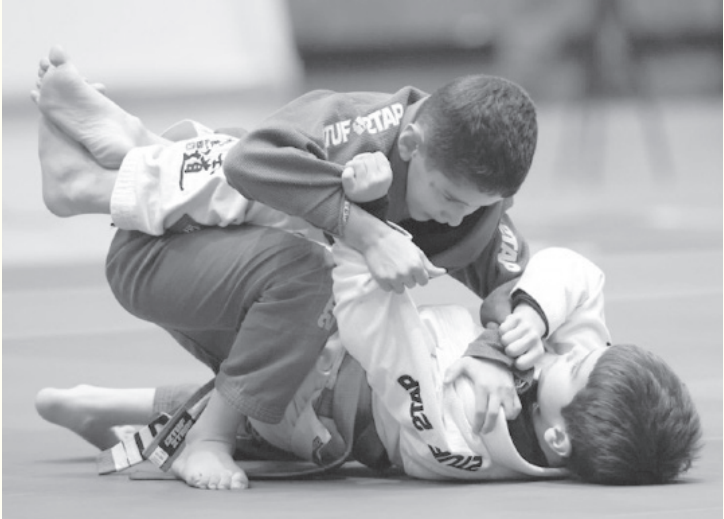
الانباط – عمان

في فئات الأطفال والناشئين والشباب والرجال وفئة الأساتذة. ويستضيف الاتحاد الأردني للجوجيتسو وفنون القتالية المختلطة جولتين من هذه البطولة الدولية التي تقام في جميع أنحاء العالم والتي يحرس لاعبو الجوجيتسو في العالم للمشاركة بها وكسب النقاط في تصنيف هذه البطولة المهمة في عالم رياضة الجوجيتسو .