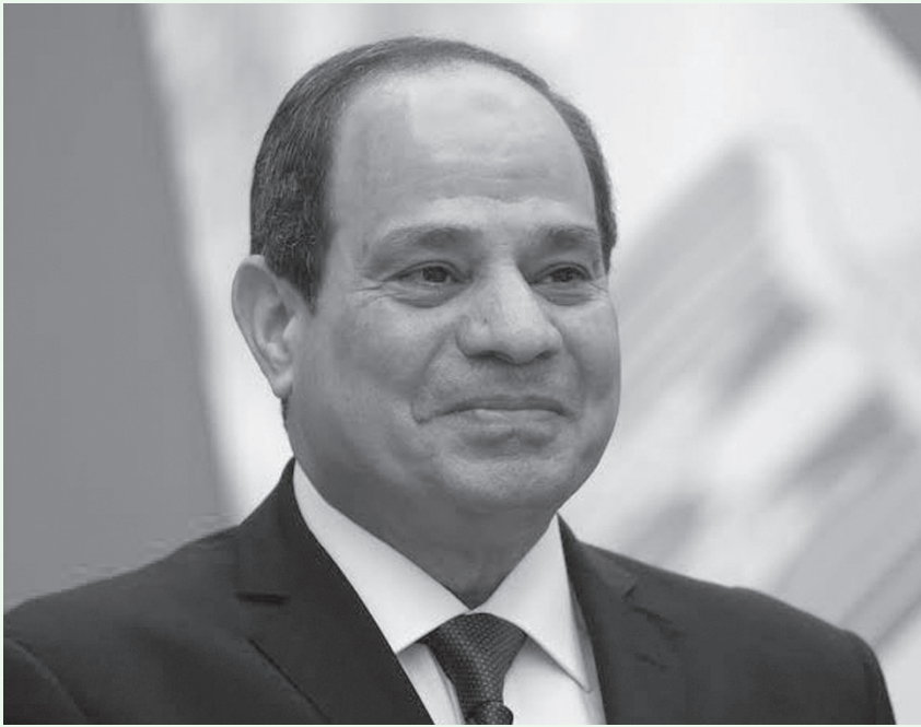
الأنباط - قتي ادهم

دعم كامل، مختصرًا المكّلة الثنائية، وهي جملة استقبلها الأعيان بالتصفيق، مؤكداً المصدر تقليل الملك من مخاطر التهجير وإمكانية حدوثه، بحكم صلابة المثلث العربي، مصر والسعودية والأردن، وصمود الغزيين على أرضهم. هاتف الملك ومكتبه، لم يعرفا الهدوء، كما هدير محرك طائرته، فالاتصالات مع الزعماء مفتوحة، واللقاءات مع الدول الأوروبية موصولة على مستوى وزراء الخارجية، وانتهت بالعاصمة الأكثر تأثيراً بعد واشنطن، وأقصّد لندن، التي هيّبت فيها الطائرة الملكية قبيل الإقلاع إلى واشنطن، التي يعرف الملك مداخل السياسة فيها معرفة دقيقة، وله فيها مسالك ومنافذ، قادرة على التأثير على القرار الرئاسي، ومراكز صنع القرار هناك. الثلاثاء القادم بتوقيف واشنطن، فجر الأربعم بتوقيف عمان، سيحلل الكثير من إزالة القلق والالتباس، وسيدرك كثيرون من أصحاب الرؤوس الحامية، أن قمة الملك ستحقق اختراقات في الموقف الأمريكي، ربما تتأخر رؤيتها، لكن عن الأحزاب السياسية، ومستعدة في الوقت نفسه لخوض المواجهة السياسية وأقول خريفي، فهي لم تظهر بعد، فلا هي مطررة ولا ربيعية، لكنها أقل حدة مما سبق تحديداً بعد انضمام الموقف السعودي إلى الموقف الأردني المصري الحاسم في رفض التهجير، بكل عناوينه سواء القسري أو الطوعي.