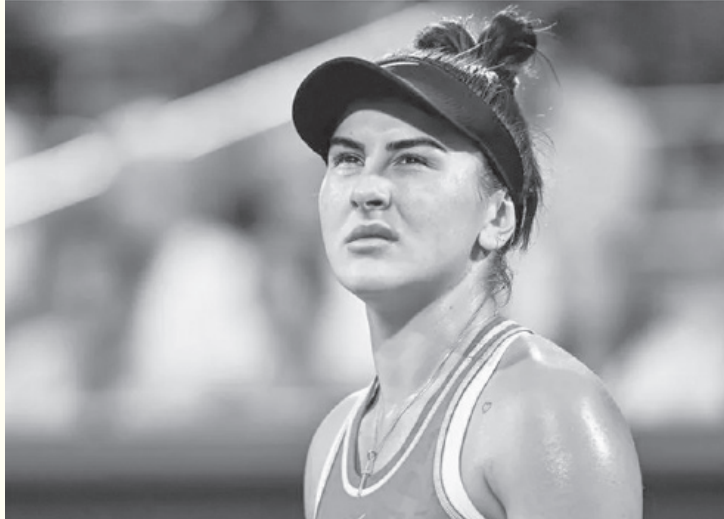
كندا – وكالات

استدعى خضوعي لعملية طارئة لاستئصال الزائدة الدودية.. وتابعت «العملية سارت بشكل سلس، وأنا في طريقي للتعافي، خطتي هي العودة إلى اللعب مع بداية موسم الملاعب الرملية، بشكل أقوى من ذي قبل». وعانت اللاعبة الكندية، البالغة من العمر ٢٤ عاما، من الإصابات خلال العامين الماضيين، وغابت لمدة ٩ أشهر بسبب مشكلة في الظهر قبل عودتها للملاعب في مايو/ أيار ٢٠٢٤، لكن آخر مشاركة لها ترجع إلى أكتوبر/ تشرين أول عبر بطولة بان باسفنيك المفتوحة.