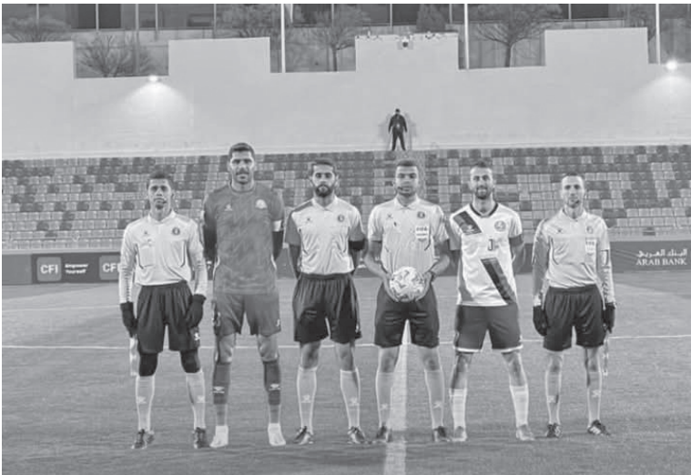
الأنباط_ميناس بني ياسين

خرج الأهلي بنقطة واحدة فقط من مواجهته أمام مغير السرحان، بعد تعادل سلبي على ستاد الأمير محمد بالزرقاء. المباراة حملت أهمية كبيرة للطرفين، حيث كان الأهلي يسعى للبقاء في المربع الذهبي، بينما حاول مغير السرحان الابتعاد عن مراكز الهبوط ورغم المحاولات الهجومية المتكررة، حالت الصلابة الدفاعية والتسرع في إنهاء الفرص دون تسجيل الأهداف. وبهذه النتيجة تراجع الأهلي إلى