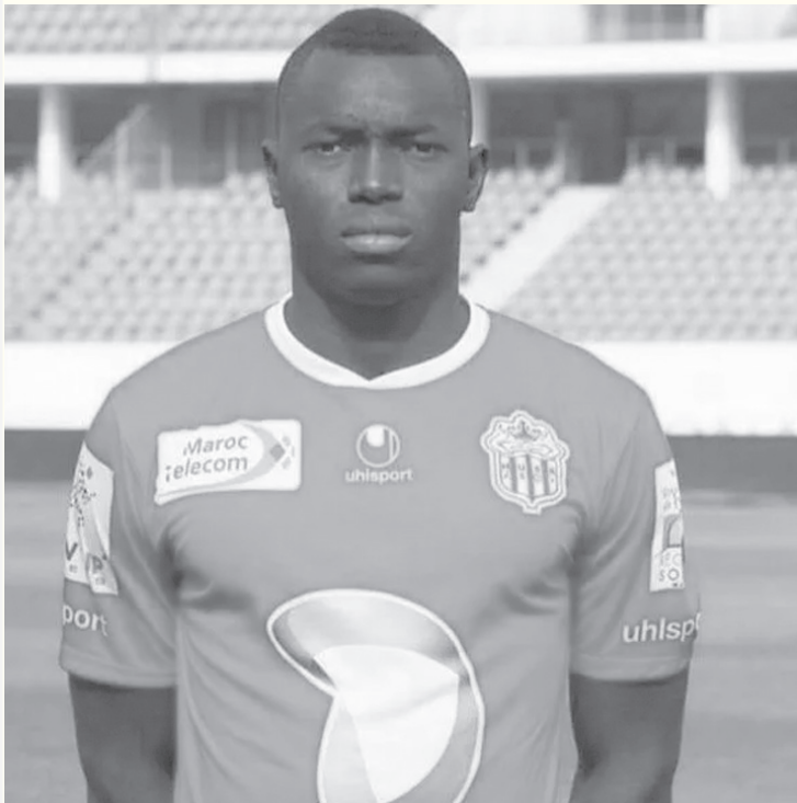
الانباط - معان

أوراقه بعد تراجع الفريق خلال الفترة السابقة تخلصها تغييرات مستمرة على الأجهزة الفنية، وغياب اللاعبين عن التدريبات بسبب عدم حصولهم على مستحقاتهم المالية، وأصبح معان الآن أكثر استقراراً، بعد تسلم عقل الدفة الفنية والتعاقدات الأخيرة التي أجراها النادي لتجنب الهبوط إلى مصاف أندية الدرجة الأولى. ويحتل معان المركز ١١ وقبل الأخير، على سلم ترتيب أندية المحترفين برصيد ٨ نقاط.