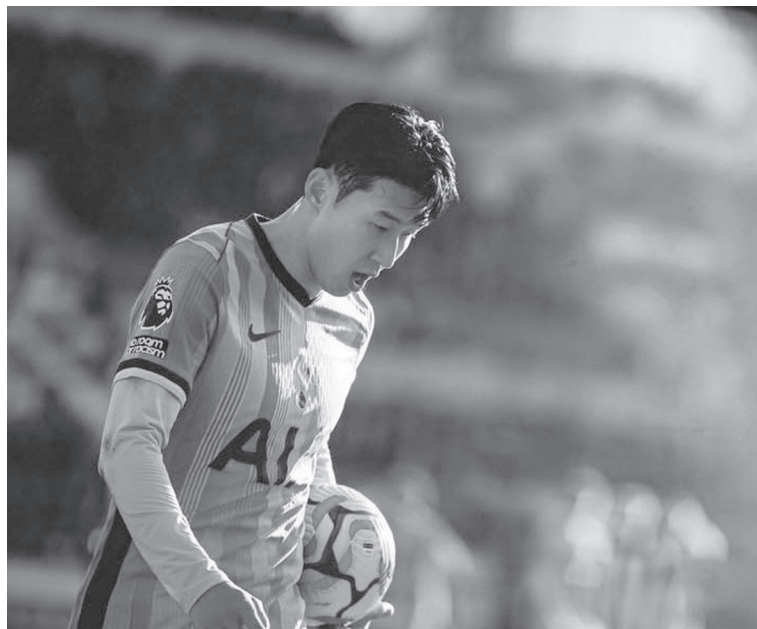
الأنباط - ميناى بنى ياسين

توتنهام يكسر سلسلة الهزائم بثنائية في شباك برينتفورد في الدوري الانجليزي عاد توتنهام لطريق الانتصارات بعد تغلبه على برينتفورد بهدفين دون رد، ضمن الجولة ٢٤ من الدوري الإنجليزي الممتاز. وسجل فيثاني جانيلت هدفًا بالخطأ في مرمى فريقه برينتفورد