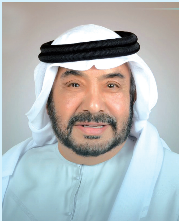
دبي - خاص - الأنباط

٣٨ دولة و ٥٠٠ - دبي أصبت شخصية بارزة مركزاً عالمياً للأفكار بمجال الابتكار المبدعة والابتكارات تشارك بالقمة لأنها مدينة المستقبل