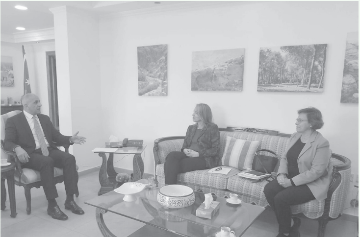
الأبناط - عمان

التقى وزير البيئة الدكتور معاوية الردايدة أمس الثلاثاء، المنسقة القيمة للأمم المتحدة في الأردن شيري ريتسيمان-أندرسون، والممثلة القيمة لبرنامج الأمم المتحدة الإنمائي رنده أبو الحسن؛ لبحث سبل تعزيز التعاون في مجال العمل المناخي وأولويات التنمية المستدامة في المملكة.