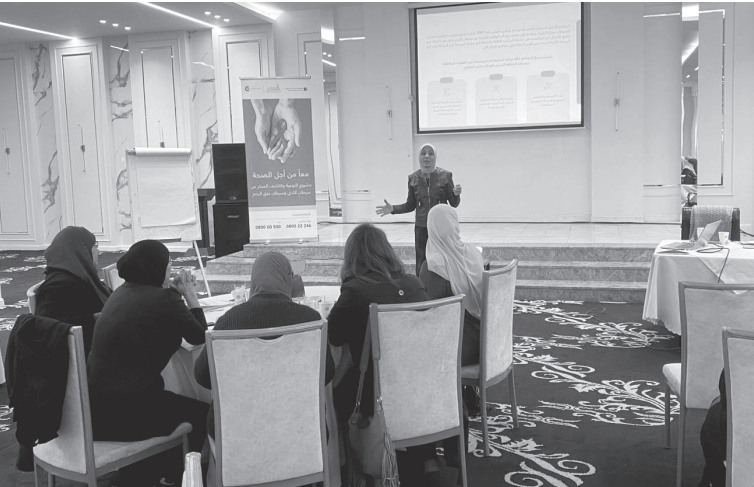
الأنباط – بترا

نظم البرنامج الأردني لسرطان الثدي تدريباً عملياً بمشاركة ٢٥ متطوعة من محافظة اربد كمثقتا للبرنامج، ضمن مشروع التوعية والكشف المبكر عن سرطان الثدي وسرطان عنق الرحم وتحت شعار ”معا من أجل الصحة“.