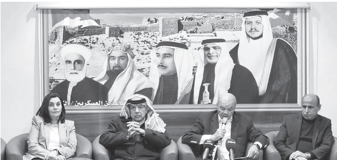
الأعيان العسكريين / الكرك

وطالب بالاحتكام إلى المنطق والحكمة والعقلانية تجاه مختلف القضايا الوطنية من خلال تجاوز حالة التشكيك بكل موقف أردني عربي، وتعزيز الحوار المسؤول والهادف والإيمان بالرأي والرأي الآخر