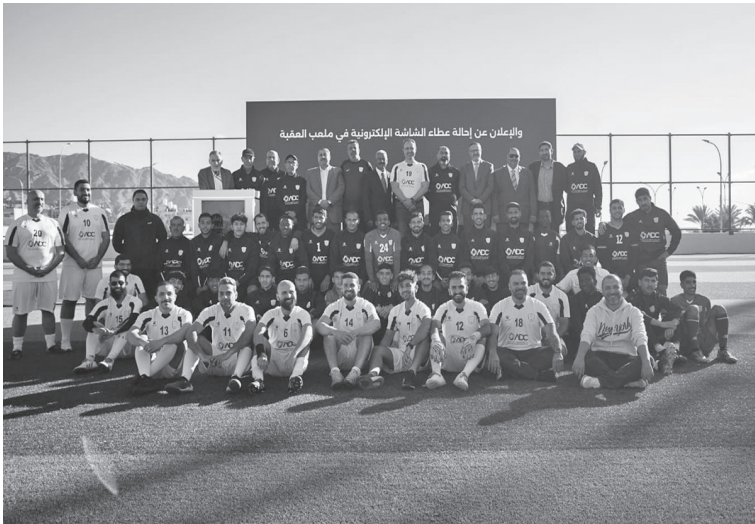
العقبة، مما يعزز من تطلعاتهم ويسهم في تطوير مهاراتهم الرياضية.

وقّعت شركة تطوير العقبة، أمس السبت، اتفاقية رعاية مع نادي شباب العقبة، لتعزيز قدرات النادي وتمكين الشباب الرياضي من تحقيق طموحاتهم وتوفير الموارد والتجهيزات اللازمة.