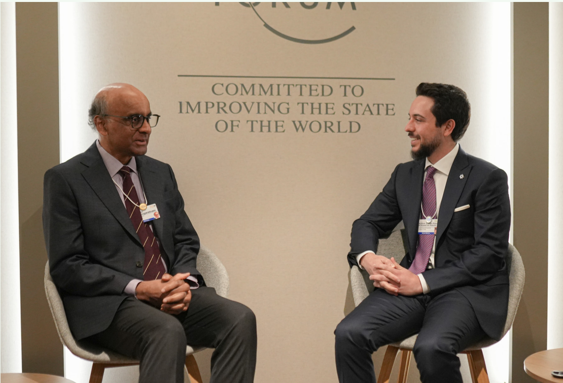
الأنباط - دافوس التقى سمو الأمير الحسين بن عبدالله الثاني ولي العهد، الرئيس السنغافوري ثارمان شانوجاراتنام، أمس الخميس، على هامش أعمال المنتدى الاقتصادي العالمي في مدينة دافوس بسويسرا. وأكد سموه، خلال اللقاء، الحرص على تعزيز العلاقات بين البلدين، وتوثيق التعاون وتبادل الخبرات في مختلف المجالات، خصوصاً الاقتصادية وقطاع الخدمات الحكومية. وأشاد سمو ولي العهد بالجهود المبذولة لتنفيذ اتفاقيات التعاون التي جرى توقيعها أخيراً خلال زيارة سموه إلى سنغافورة. وتطرق اللقاء إلى تطورات المنطقة، إذ جدد سمو ولي العهد التأكيد على ضرورة تكثيف الجهود لضمان تثبيت وقف إطلاق النار في غزة، ومضاعفة المساعدات الإنسانية وضمان وصولها. وأعرب سموه عن تقديره لمواقف سنغافورة المؤيدة لجهود تحقيق السلام بالمنطقة، ودعمها لوكالة الأمم المتحدة لإغاثة وتشغيل اللاجئين الفلسطينيين