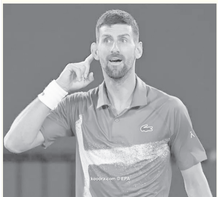
سبدي - وكالات

وسط تشجيع حماسي من الجماهير للنجم الصربي. واعتبر ديوكوفيتش أن جونز «سخر من المشجعين الصرب، وأدى بتعليقات مهينة ومسينة تجاهي». وبعد فوزه على التشيكي ييري ليتشيكيا بثلاث مجموعات متتالية، وبلوغه ربع نهائي بطولة أستراليا المفتوحة، كان من المتوقع أن يتحدث ديوكوفيتش إلى اللاعب السابق، جيم كورير، عبر التليفزيون. لكن عوضاً عن ذلك، أمسك بالميكروفون وقال «جزيل الشكر على تواجدهم الليلة، أقدر حضوركم ودعمكم، وسأراكم في الدور التالي.. شكراً جزيلاً لكم..»