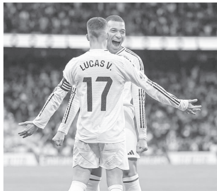
الانباط - مينا بني ياسين

ريال مدريد يعود للصدارة برباعية ساحقة أمام لاس بالماس