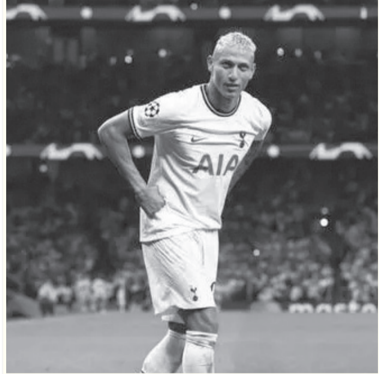
لندن - وكالات

بالرحيل، بعد سقوطه من حسابات مدرب السبيرز، الأسترالي أنجي بوستوكوجلو. وغاب ريتشارليسون عن عديد المباريات، الموسم الماضي، بسبب الإصابة.. لكنه نجح في تسجيل 12 هدفا خلال 31 مواجهة خاصة، في جميع المسابقات. وشارك البرازيلي في 8 مباريات فقط، في جميع البطولات هذا الموسم، وأحرز هدفاً وقدم تمريرة حاسمة، خلال 180 دقيقة لعب.