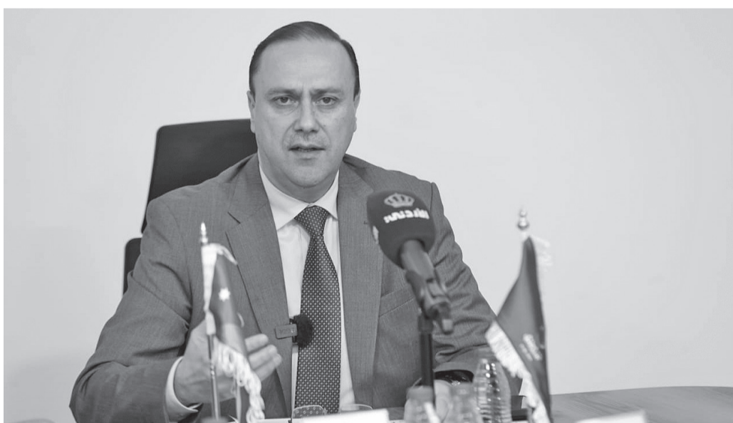
الأخبار - عمان

أرجع وزير الاتصال الحكومي الناطق الرسمي باسم الحكومة، الدكتور محمد المومني، ارتفاع مستويات الرضا الشعبي عن أداء الحكومة في استطلاعات الرأي الأخيرة إلى الزيارات الميدانية للحكومة واشتباكها مع الملفات وكثافة عملها وطبيعة القرارات التي اتخذتها لتخفيف الأعباء الاقتصادية عن المواطنين.