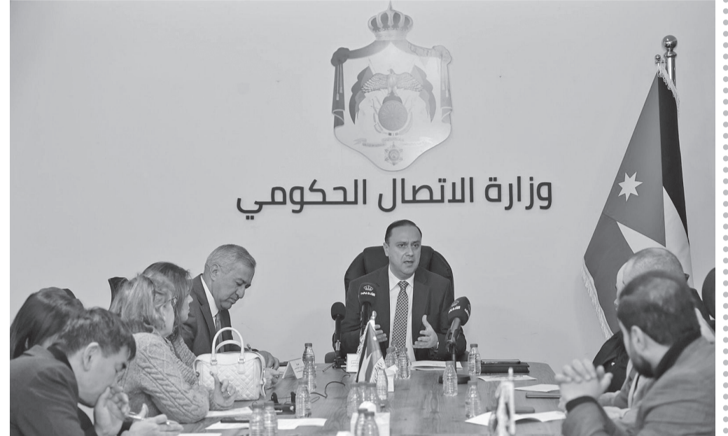
وزارة الاتصال الحكومي

الهاشمية، تجهيز أكبر قافلة مساعدات متوجهة إلى غزة، مبيناً أن القافلة مكونة من ١٢٠ شاحنة محملة بمساعدات غذائية وإغاثية وطبية، وهي القافلة رقم ١٤٠ المتجهة إلى القطاع منذ بدء العدوان الإسرائيلي على غزة. وشدد على أن الأردن وظف جميع جهوده الدبلوماسية والسياسية والإعلامية والإغاثية لتصرة الأشقاء في غزة والضفة الغربية، مجدداً التأكيد على أن إقامة الدولة الفلسطينية المستقلة ذات السيادة على خطوط الرابع من حزيران لعام ١٩٦٧ وعاصمتها القدس الشرقية هي مصلحة عليا أردنية لتثبيت الشعب الفلسطيني على ترابه الوطني. كما أشار إلى أن الأردن يدعم الشعب السوري في التعامل مع المرحلة الانتقالية التي يمر بها، بما يضمن استعادة سوريا عافيتها ومؤسساتها وأمنها واستقرارها، الذي ينعكس على أمن واستقرار المنطقة برمتها.