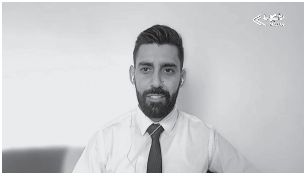
الأخبار - محمد شاهين

واختتم رستم حديثه قائلًا: "لا تزال في وقت حساس تشهد فيه سوريا مرحلة انتقالية صعبة، حيث يسعى الشعب السوري إلى استعادة الاستقرار الداخلي بينما تواجه الحكومة الجديدة تحديات سياسية واقتصادية جمة. أما العلاقات الأردنية السورية فهي في مرحلة تطور مستمر، حيث يسعى الأردن إلى تأكيد دوره كلاعب رئيسي في استقرار المنطقة، مع تعزيز التعاون الأمني والاقتصادي بين البلدين".