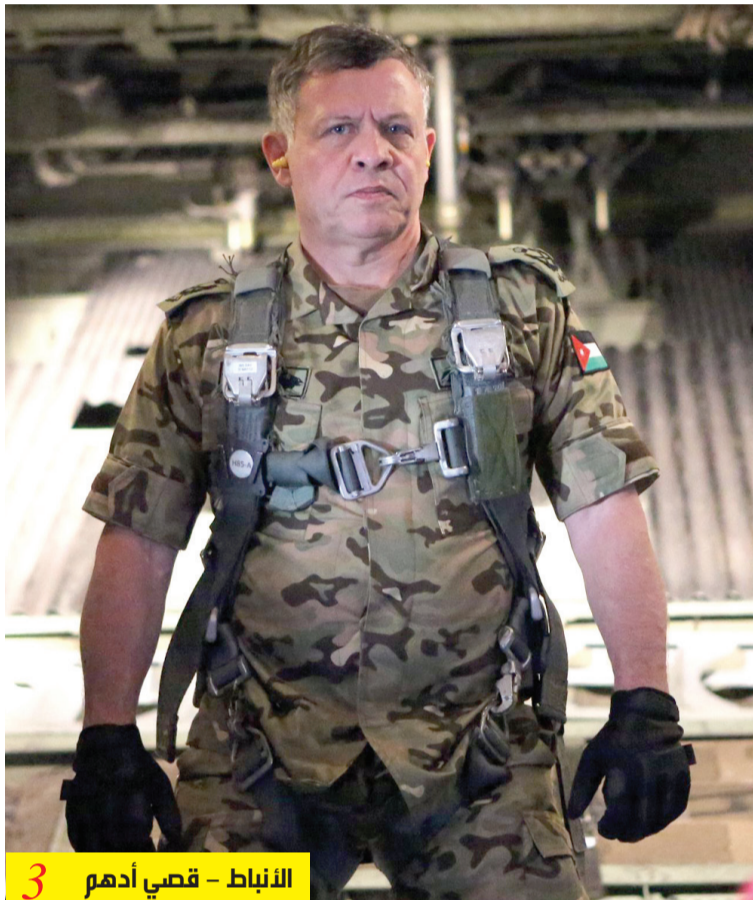
الأنباط - قصي أدهم 3

إطلاق النار في قطاع غزة استعزز سلطة ترامب على الدول العربية التي ساعدت في التوسط للوصول إلى الهدنة، وعلى رئيس وزراء الاحتلال الإسرائيلي بنيامين نتنياهو. التهديدات أو تبريد نقاط السخونة في الشرق الأوسط ليست نهاية المطاف، بل تفتح أبواب أسئلة أكثر تعقيداً تتعلق بالشرق الأوسط، ومن أبرزها: من الذي يجب أن يحكم غزة بعد الحرب؟ وما إذا كان ينبغي تمكين اليمين المتطرف في إسرائيل، أو تقييده لتحقيق صفقة كبرى أساسها توقيع اتفاقية سلام مع السعودية؟ أم أنه ما زال مؤمناً بصفقة القرن سنة الصيت؟ وما هو موقفه من أجندة اليمين الصهيوني الطموحة، حيث يطمون بإعادة بناء المستوطنات في قطاع غزة وضم الضفة الغربية، بعد أن فتحت شهيتهم بالتوغلات الإسرائيلية الأخيرة في لبنان وسوريا، في ضوء أن بنيامين نتنياهو لم يتعهد بالتخلي عن سياسة الضم إلى الأبد. فهو ترك الباب مفتوحاً، ربما للحفاظ على تماسك حكومته اليمينية، وربما لأنه ينتظر فعلاً وصول ترامب إلى مقعد القيادة وإعادة أحلام صفقة القرن الموعودة.