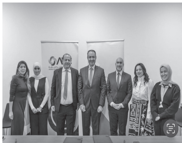
الأخبار - العقبة

أعلنت شركة تطوير العقبة عن شراكة مع مؤسسة الملكة رانيا لتنفيذ برنامج "اقرأ لي" الذي يهدف إلى تشجيع أولياء الأمور في مدينة العقبة على تبني سلوكيات فعّالة في القراءة مع أطفالهم من عمر الولادة حتى عمر الخمس سنوات.