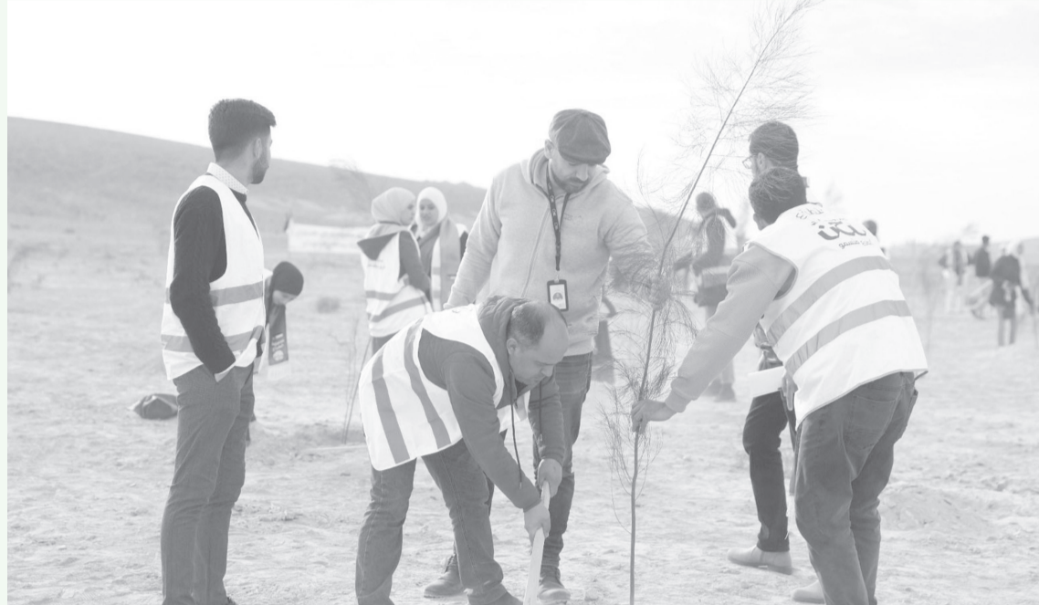
الأنباط- محمد شاهين

مندوباً عن جلالة الملك عبدالله الثاني، رعى رئيس الوزراء الدكتور جعفر حسان انطلاق احتفالات محافظات المملكة بيوم الشجرة، والتي بدأت في كلية معان الجامعية. وشارك رئيس الوزراء، بحضور وزير الزراعة المهندس خالد الحنيفات، قرابة مئتي شاب وشابئة من محافظة معان بزراعة الأشجار في كلية معان الجامعية، وذلك في إطار سعي الحكومة لزيادة الرقعة الحرجية والمساحات الخضراء لمواجهة التصحر.