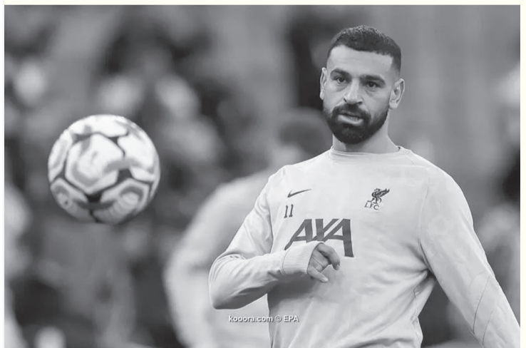
الرياض - وكالات

برنامج سبورتنج ستر، المذاع على القنوات الرياضية السعودية، فإن نادي الهلال يفاوض محمد صلاح من أجل الانتقال إلى صفوفه بمبلغ 300 مليون ريال سعودي لمدة سنتين. وأوضحت المصادر ذاتها، أن المفاوضات الحالية تخص فترة الانتقالات الصيفية المقبلة، كما أن هناك مفاوضات من أجل معرفة إمكانيات ضم صلاح خلال فترة الانتقالات الحالية. ويقدم صلاح مستويات مذهلة في الوقت الحالي مع الريز، ويتصدر قائمة هدافي الدوري الإنجليزي برصيد 18 هدفاً.