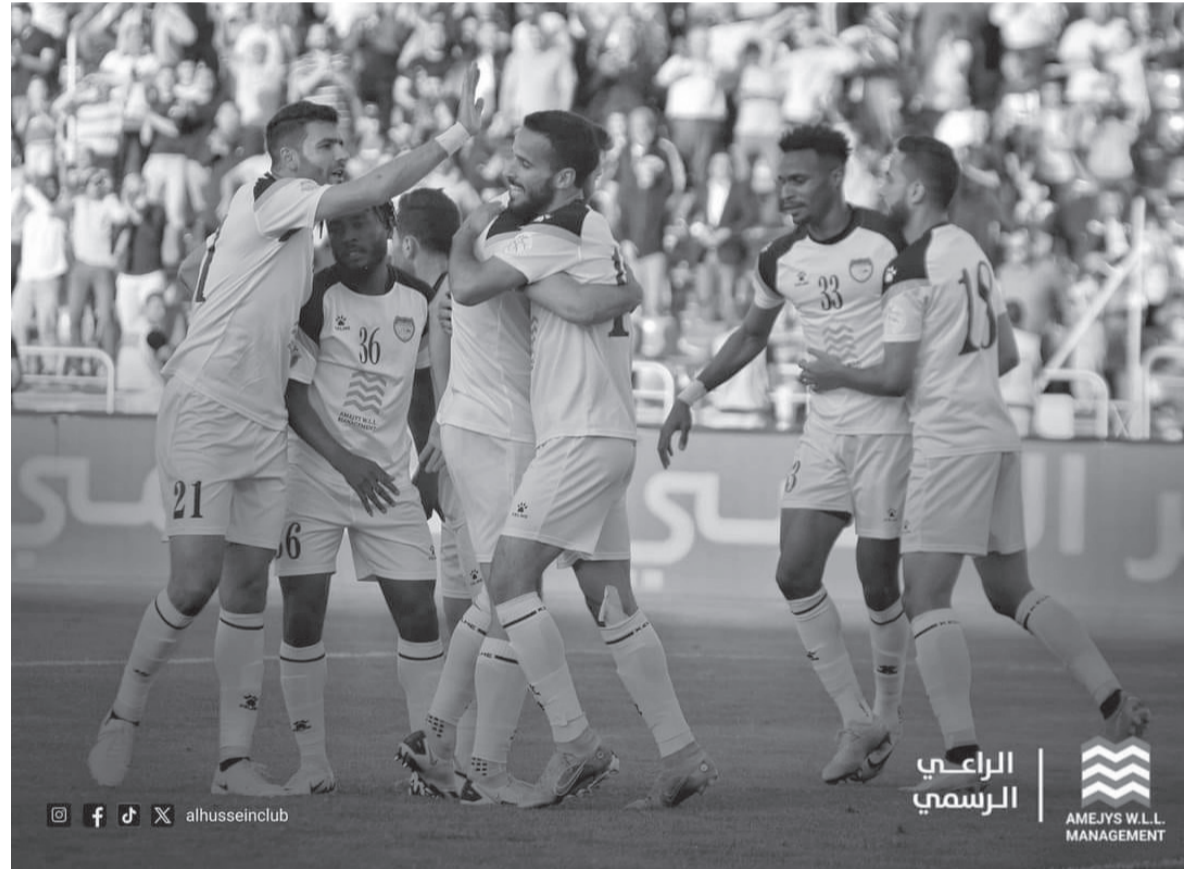
الرعاية الرسمية AMEJYS W.L.L. MANAGEMENT