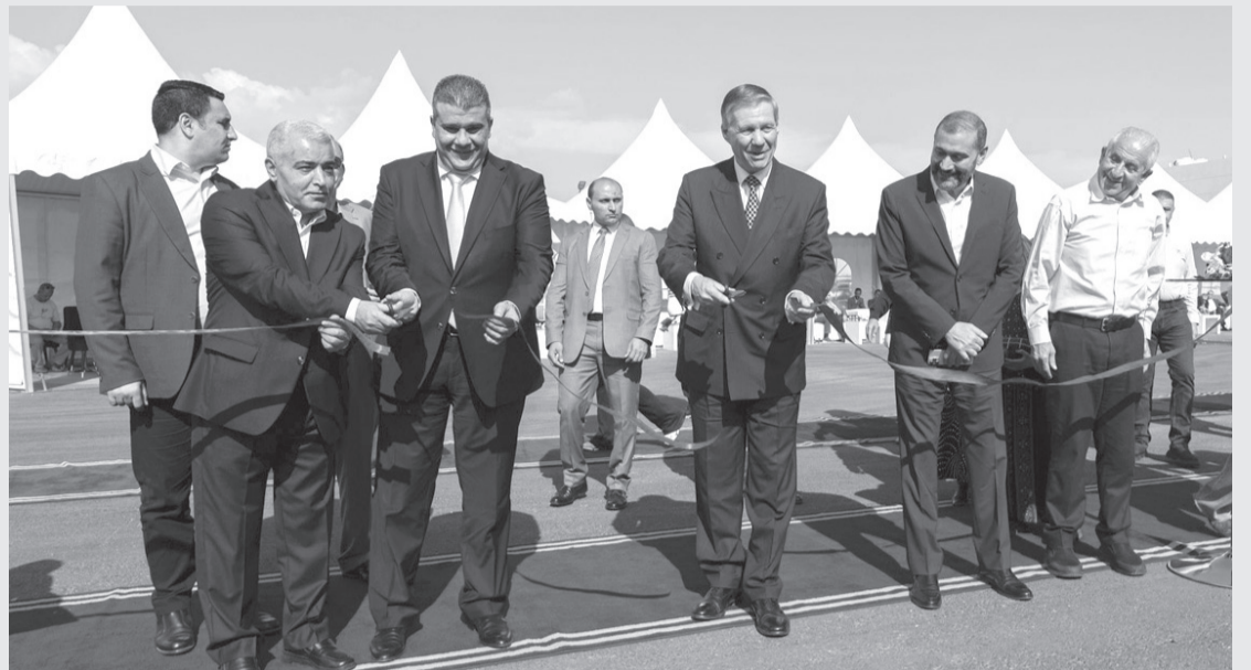
الأنباط - العقبة

والحصري لجاكوار ولاند روفر في الأردن، أول محطة شحن مركبات كهربائية متكاملة الخدمات في مدينة العقبة. يأتي هذا الإنجاز كجزء من الشراكة الاستراتيجية بين جوبترول ومحمودية موتورز، التي تهدف إلى تعزيز البنية التحتية لمحطات شحن المركبات الكهربائية في المملكة، بما ينسجم مع رؤية الأردن لمستقبل أكثر استدامة في قطاع الطاقة والنقل. تقع المحطة في موقع استراتيجي على طريق مطار الملك الحسين بالقرب من مستشفى الأمير هاشم، مما يسهل الوصول إليها من قبل سكان المدينة وزوارها، وتعد