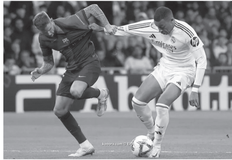
جدة - وكالات

يتجدد العهد مع الكلاسيكو هذا الموسم، لكن هذه المرة في الأراضي السعودية التي ستحتضن مباراة مرتقبة بين برشلونة وريال مدريد في نهائي كأس السوبر الإسباني. وحجز البارسا مقعد في النهائي بفوزه على أنتيك بيلباو بهدفين دون رد، قبل أن يلحق به غريمه بإسقاط ريال مايوركا بثلاثية دون مقابل. وستعج الأ نظار صوب ملعب الجوهرة المشعة مساء الأحد، لمعرفة هوية بطل السوبر الإسباني هذا العام بعد انتهاء الكلاسيكو المرتقب. وتغلف مباراة الكلاسيكو الثانية هذا الموسم برغبة الثأر من جانب كلا الفريقين، إذ يسعى ريال مدريد للانتقام من سقوطه المدي الرباعية دون رد على أرضه أمام الفريق الكتالوني في تشرين الأول/أكتوبر الماضي بالدوري الإسباني، تلك الخسارة أنهت سلسلة انتصارات الريال المتتالية في الكلاسيكو، والتي استمرت لـ ١٤ مواجهات بين نيسان/أبريل ٢٠١٣ و نيسان/أبريل ٢٠٢٤. لكن رغبة الانتقام تغزو عقول لاعبي برشلونة أيضا.