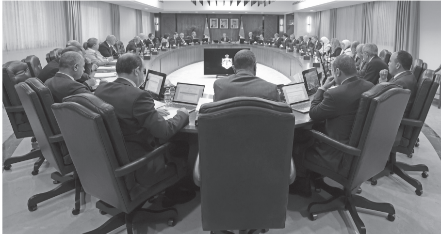
حاجة السوق المحلي.

ومن شأن القرار تعزيز تنافسية المنتج الأردني من حيث السعر والوجود من خلال دعم التصدير الجوي والبحري. كما أن دعم صادرات محصول الليمون جاء في ظل توفر فائض كبير من مادة الليمون تصل إلى نحو ٥ أضعاف