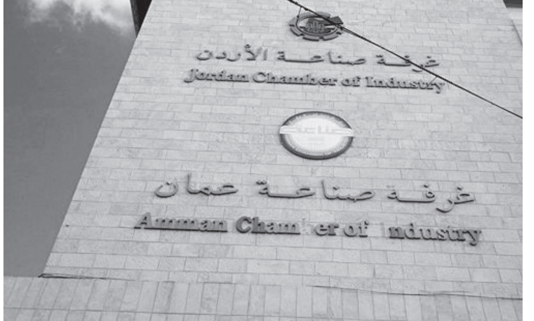
الأنباط - بتر

يشار إلى أن غرفة صناعة عمان التي تأسست عام ١٩٦٢ تضم في عضويتها حالياً ٨٦٠٠ منشأة صناعية، وتشغل ١٥٩ ألف عامل وعاملة برأس المال يصل لنحو ٥ مليارات دينار.