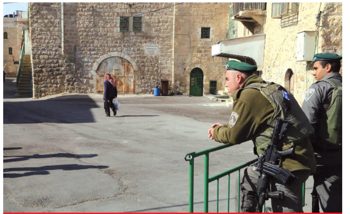
6 الأنباط - الالف تيسير