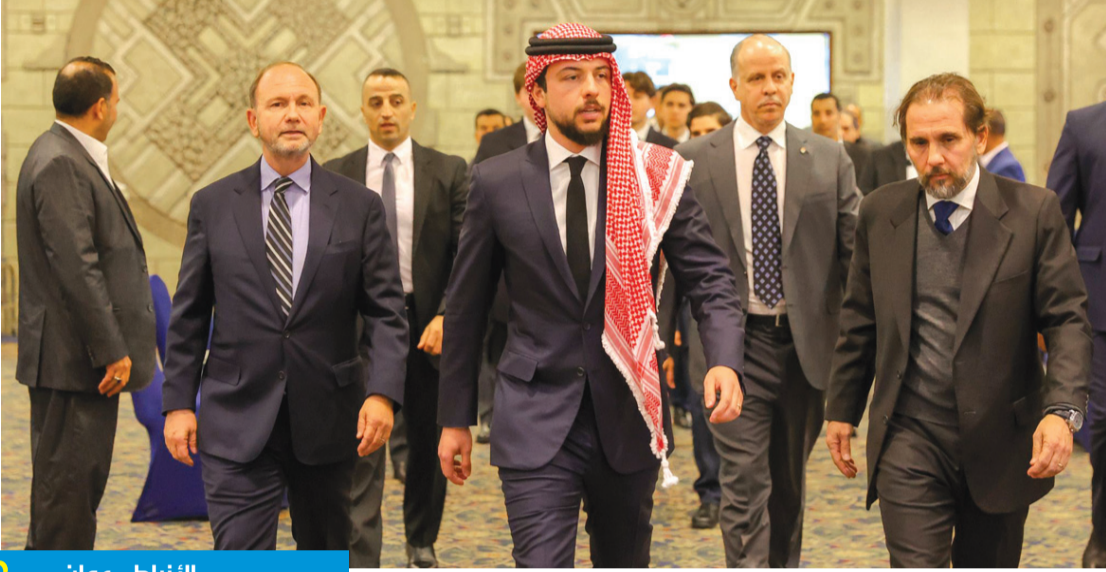
2 الأنباط - عمان