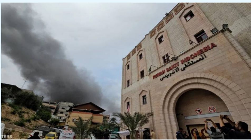
التفاصيل ص ٥

وقالت مصادر طبية إن جيش الاحتلال دمر محطات الأوكسجين والكهرباء، حيث بات المستشفى لا يملك القدرة على تقديم خدمات طبية، كما نفذت المستلزمات الطبية، التفاصيل ص ٥