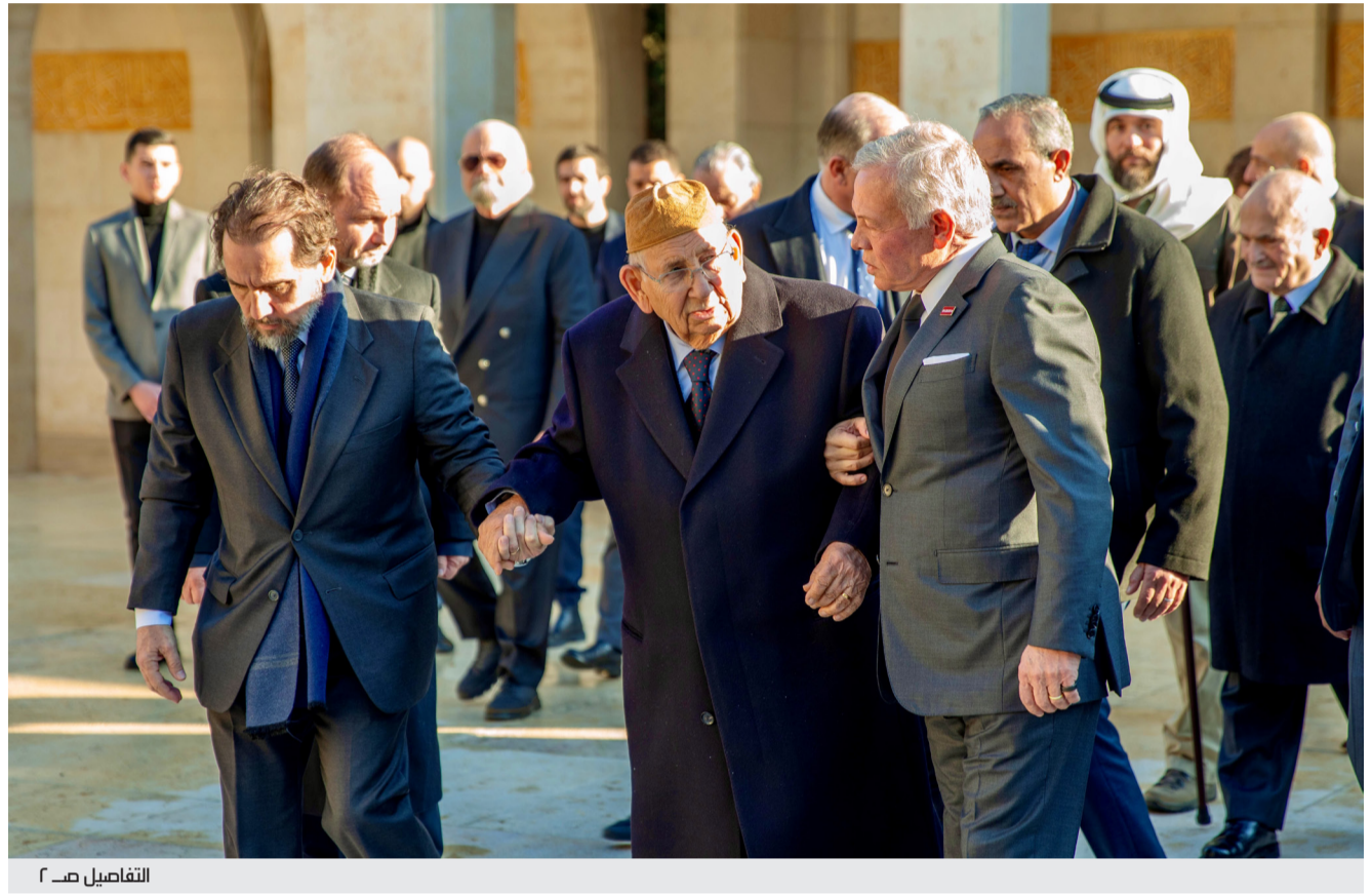
التفاصيل ص ٢