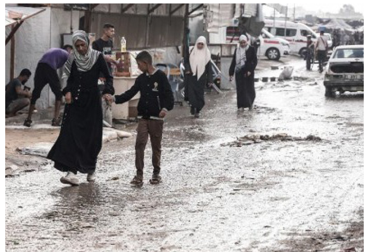
الأنباط - وكالات 7