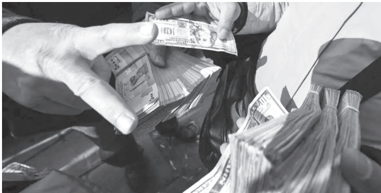
الأنباط - وكالات

انتشرت دولارات مزورة بنسبة تطابق عالية مع الأصلية، تتراوح بين ٩٠ إلى ٩٥ بالمئة، في أسواق دمشق. وأشار تقرير لتلفزيون سوريا، إلى أن ”هذه الأوراق النقدية، خاصة من فئة ١٠٠ دولار، تتسبب في إرباك كبير لكونها تخدم أجهزة الكشف التقليدية المستخدمة على نطاق واسع في سوريا“. وأوضح البعض ممن تعرضوا للخداع، أن هذه الأوراق المزورة تشبه الأصلية من حيث الملمس والشريط ثلاثي الأبعاد والعلامة المائية، إلا أن الاختلافات تكمن في أن الشخصية المطبوعة بالدائرة البيضاء والشريط المخفي يظهران مطبوعين بدقة لا يمكن كشفها إلا بتسليط الضوء خلف الورقة. وإفاد التقرير بأن هذه الدولارات المزورة، تباع علناً عبر منصات التواصل الاجتماعي، وبأسعار تقل كثيراً عن سعر الصرف في السوق السوداء. ولفت إلى أن ذلك أدى إلى لجوء الصرافين والتجار إلى فحص الأوراق النقدية بدقة، أو التعامل بكميات صغيرة لتسهيل عملية الفحص، مما يزيد من صعوبة التصريف للكميات الكبيرة.