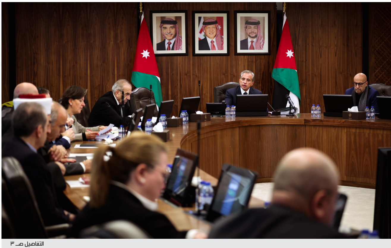
التفاصيل ص ٣