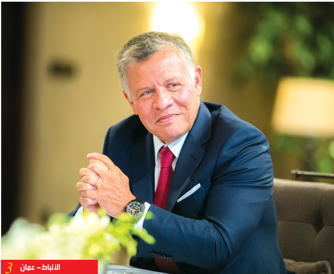
الأنباط - عمان 3