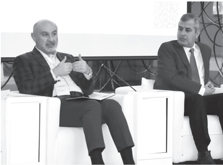
الأنباط – عمان