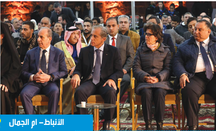
الأنباط - أم الجمال 2

أضاء رئيس الوزراء الدكتور جعفر حسان مساء أمس الاثنين، شجرة عيد الميلاد المجيد في موقع أم الجمال الأثري في البادية الشمالية الشرقية، الذي تم إدراجه ضمن قائمة التراث العالمي لليونسكو في شهر تموز الماضي.