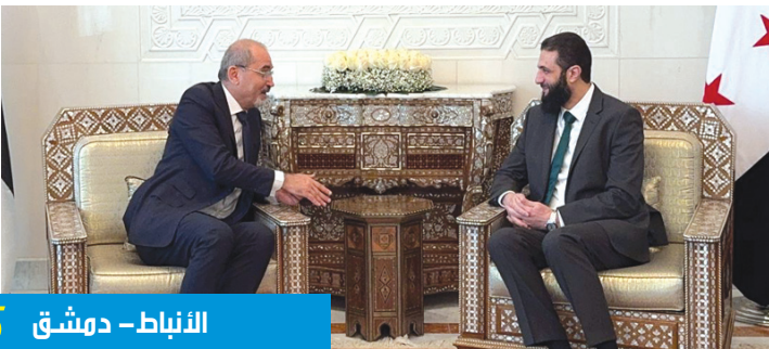
الأنباط - دمشق 5

التقى نائب رئيس الوزراء وزير الخارجية وشؤون المغتربين، أيمن الصفدي، أمس الاثنين، القائد العام للإدارة الجديدة في سوريا أحمد الشرع.