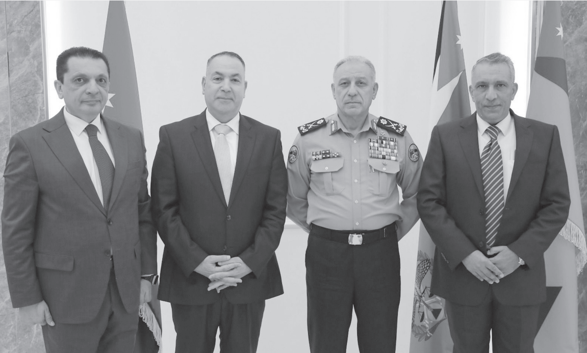
المتقاعدون هذا التكريم، مؤكدين أنهم سيبقون الجند الأوفياء للوطن ولقيادته الهاشمية الحكيمة، متمنين التوفيق والنجاح لزملائهم العاملين في مواقعهم كافة.