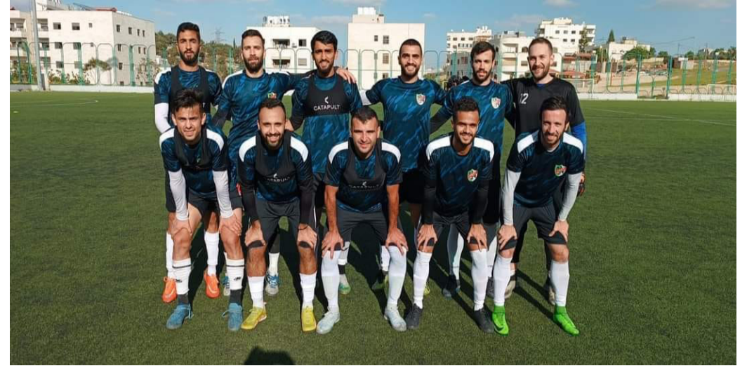
الانباط - عمان الدوري الأردني للمحترفين موسم ٢٠٢٤/٢٠٢٥ باقامة مباراتين حيث يلتقي في الأولى شباب الأردن مع معان عند الخامسة مساء على ملعب البترا، قبل أن يستضيف الأهلي تتواصل مساء السبت منافسات الأسبوع العاشر من

نظيره الرمثا عند ٧:٤٠ مساء على ستاد عمان الدولي في المباراة الثانية.. يذكر أن الاتحاد قام بتأجيل مباراتي الوحدات والجزيرة، وشباب العقبة والحسين، ضمن ذات الأسبوع، بسبب مشاركة فريقا الحسين والوحدات في بطولة دوري أبطال آسيا ٢٠٢٤. في المباراة الأولى يسعى فريق شباب الأردن ١١ نقطة للفوز والتقدم خطوة جديدة نحو مراكز المقدمة هربا من موقعه الحالي بعد العروض الجيدة التي قدمها مؤخرا.. في المقابل ينظر فريق معان ٨ نقاط هو الآخر لنقاط الفوز بعد أن تراجعت نتائجه في الفترة الاخيرة واستقر في مركز يقربه من الهبوط ولهذا يتوقع أن تشهد المباراة الكثير من الاتارة والتشويق لرغبة الفريقين بتحقيق الفوز والهروب من مناطق الخطورة.. في المباراة الثانية جهز فريق الاهلي ١٦ نقطة لفريقه للعودة من جديد الى الانتصارات والمنافسة على لقب البطولة وهو الذي تراجع في المباريات الاخيرة وتخلي عن الصدارة التي احتلها اسابيع طويلة ويسعى اليوم للعودة الى الفوز وهو يستضيف منافسه الرمثا ١٧ نقطة وصاحب المركز الثاني مع الوحدات والذي ينظر للفوز بذات الاهمية للبقاء قريبا من المقدمة بعد العروض القوية التي قدمها مؤخرا واعادت الى اذهان عشاقه ذكريات الفريق المميز..