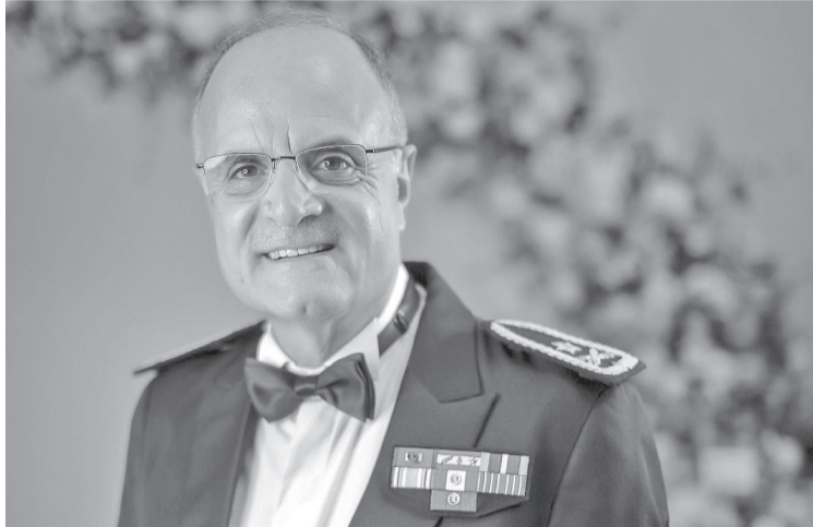
الأنباط - الالف تيسير

وانتقد تصدير الإعلام في تغطية وتسليل الضوء على الجرائم الوحشية التي يرتكباها الاحتلال، من مجازر مروعة في مناطق البقاع وبلعيك وعلى استهداف "العدو" لننازلهم ومعاقبة أهاليهم وذويهم وملاحقتهم من قبل "العدو الصهيوني" وأكد أن "العدو الصهيوني" لا يمكن الوثوق به، إذ يستخدم ومن الممكن أن يتخذ وسائل متعددة لعرقلة المفاوضات، ما يستدعي قراءة حذرة للمشهد السياسي، ورغم ذلك نعت إلى التعامل مع الوضع بتفاهل مدروس، مع التركيز على حماية السيادة اللبنانية وضمان التزام جميع الأطراف بالشروط التي تخدم مصلحة الدولة والشعب اللبناني إذ تعكس التصريحات قلقاً متزايداً من احتمالية تكرار سيناريوهات سابقة، وسط استمرار الغموض حول مستقبل المفاوضات.