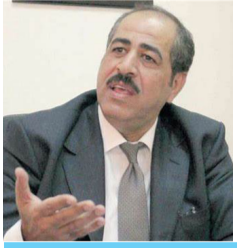
استهلال طيب للحكومة