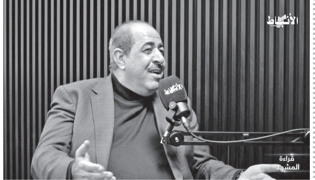
الأنباط - محمد شاهين

اختتم قشوع حديثه بالتأكيد على أن الأردن سيبقى مدافعاً عن الحقوق الفلسطينية وحامياً للمقدسات، مستنفاً إلى إرثه التاريخي ودوره الإقليمي والدولي. كما أشاد بجهود الإعلام الأردني في نقل الحقائق والدفاع عن القضايا الوطنية، معتبراً أن الإعلام يمثل ركيزة أساسية في تعزيز الوعي العالمي بالقضية الفلسطينية.