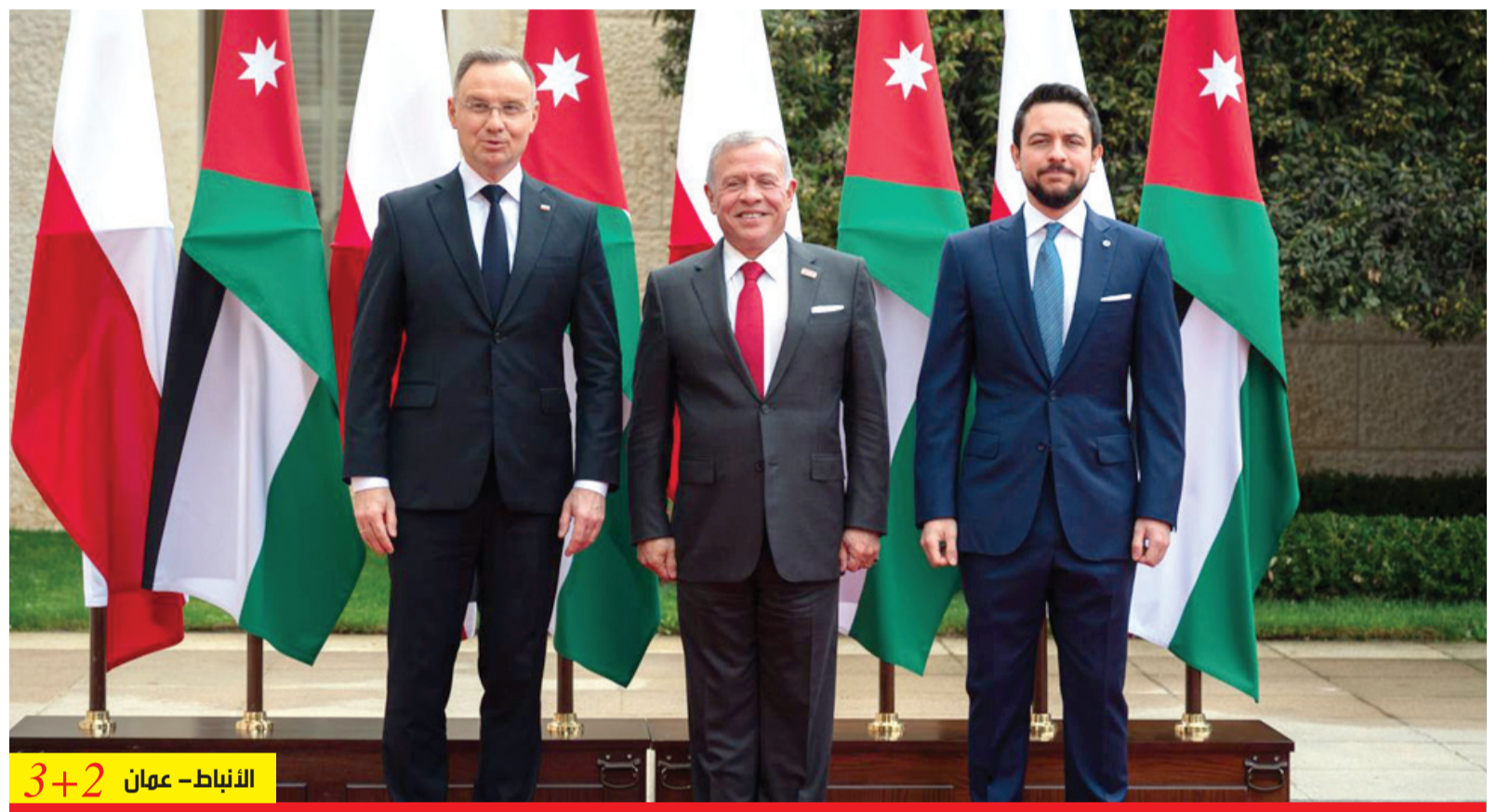
نرحب بزيارة الرئيس دودا بالتزامن مع ٦٠ عاماً على العلاقات بين بلدينا الأنباط - عمان 3+2