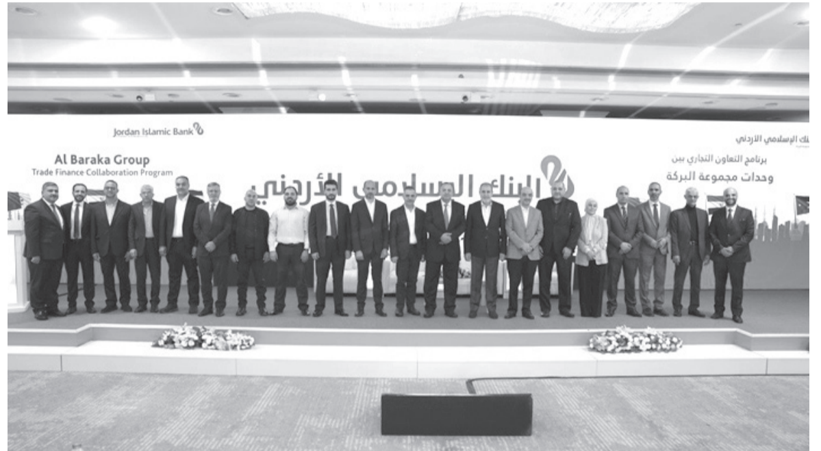
بنك الإسلامي الأردني