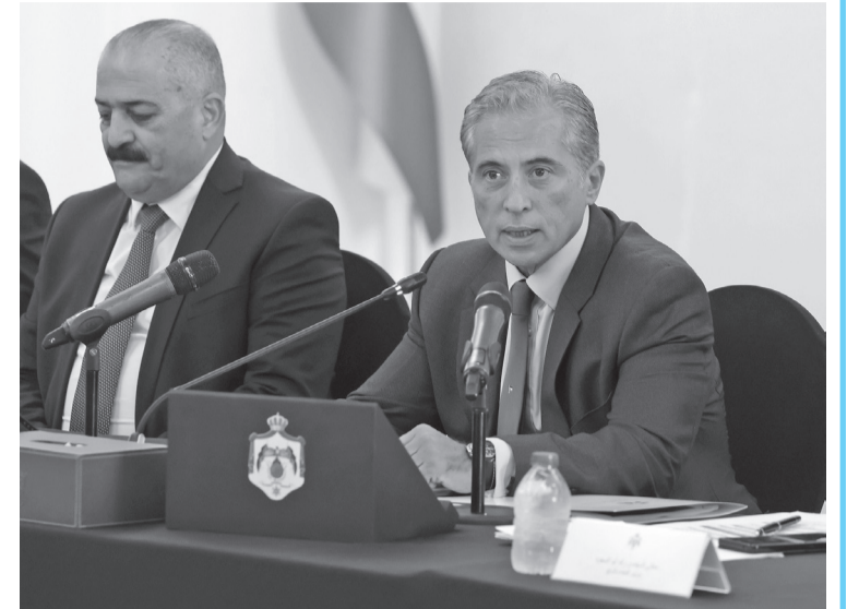
الأبناط - إربد

وضع رؤية تنمويّة للأعوام المقبلة يتمّ الاتّفاق عليها، تمكّنتنا من ترتيب الأولويّات بالتعاون مع المجالس المنتخبة والهيئات المدنيّة في كلّ محافظة، ضمن ما هو متاح من موارد. وأضاف "سنسرّع إنجاز المشاريع المتأخّرة، ونبني هذه الرؤية التّمنويّة ونلتزم بها ونعمل على تنفيذها وفق مُدّد زمنيّة واضحة؛ حتى تكون مساهمات واضحة فيما نقوم به..