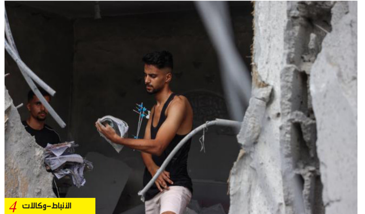
النياب - وكالات 4

بفقدان فرصهم في التعليم ومستقبلهم الأكاديمي في حال عدم فتح المعبور، وتسهيل سفرهم في أقرب وقت. وقيل بدء حرب الإبادة الإسرائيلية كان منات الطلاب الفلسطينيين في القطاع يدرسون في جامعات بمصر والجزائر وتونس والمغرب ودول أخرى، بعضها أوروبية.