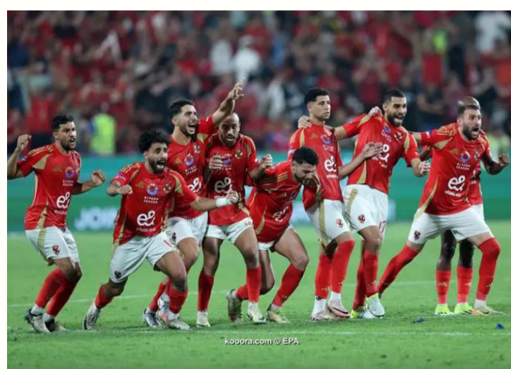
القاهرة - وكالات

٣١ فريقاً للمشاركة في النسخة الجديدة من البطولة ويتبقى فقط بطل أمريكا الجنوبية في النسخة الحالية. وينتظر الأهلي الموقف النهائي من إعلان الضيفاء سواء بحضور مندوب رسمي من عدمه. وتأهل الأهلي لتتبع نهائي بطولة الإنتركونتيننتال وحصد لقب كأس الثلاث قارات بعد الفوز على العين الإماراتي بثلاثية نظيفة في المباراة التي أقيمت بينهما مساء الثلاثاء الماضي باستاد القاهرة.