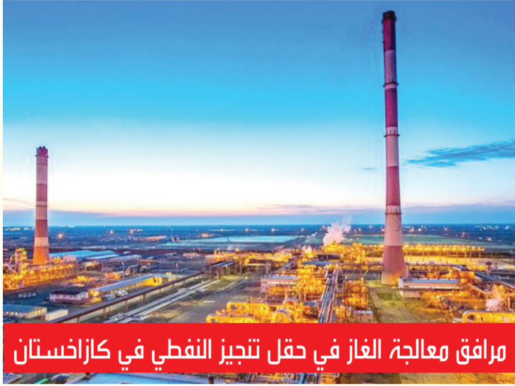
مرافق معالجة الغاز في حقل تنجيز النفطي في كازاخستان