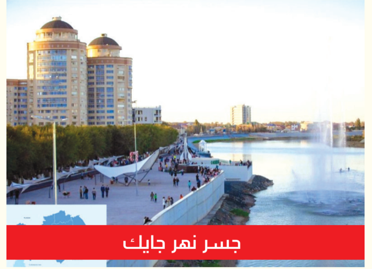
جسر نهر جايك