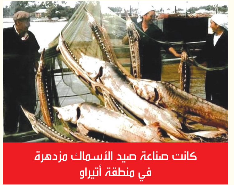
كانت صناعة صيد الأسماك مزدهرة في منطقة أتيراو

«يجب أن تصبح مستقلاً وتتعلم كيفية تنظيم وقت فراغك. يأتي بالفعل الأشخاص المستقرون والناسجون إلى هنا. يمكنك رؤيتهم يتجولون على مهل على طول الجسر الجديد ويجلسون لتناول الإفطار دون قلق. وقالت: «لا يمكنك حتى العثور على طاولة خالية في مقهى في عطلات نهاية الأسبوع، يمكن للزوار والسكان المحليين التنزه