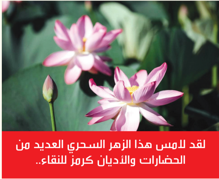
لقد لامس هذا الزهر السحري العديد من الحضارات والأديان كرمز للنقاء..

على طول ضفة نهر جايك، والاستمتاع بالمناظر الخلابة والهواء الطلق. كما يزور العديد منهم زقاق إسباتاي ومخامبيت، وهو ممشى هادئ تصطف على جانبيه المساحات الخضراء، أو يتوقفون عند المسجد المركزي، وهو رمز مذهل لتقاليد المدينة وروحانياتها. المسجد المركزي لمدينة أتيراو (شرح صورة) الجسر الذي يربط بين نصفي أتيراو - الجانب الأوروبي والجانب الآسيوي القسم بواسطة نهر جايك - هو أيضاً مكان شهير لالتقاط الصور، وخاصة أثناء غروب الشمس في كل عام، يتوسع مشهد الترفيه في المدينة، مع افتتاح مقاهي جديدة وبارات كاريوكي ومطاعم، مما يجلب جواً أكثر حيوية إلى المدينة التي كانت هادئة ذات يوم.