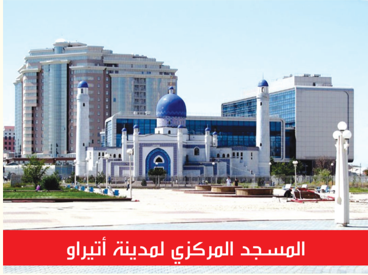
المسجد المركزي لهدينة أتيراو