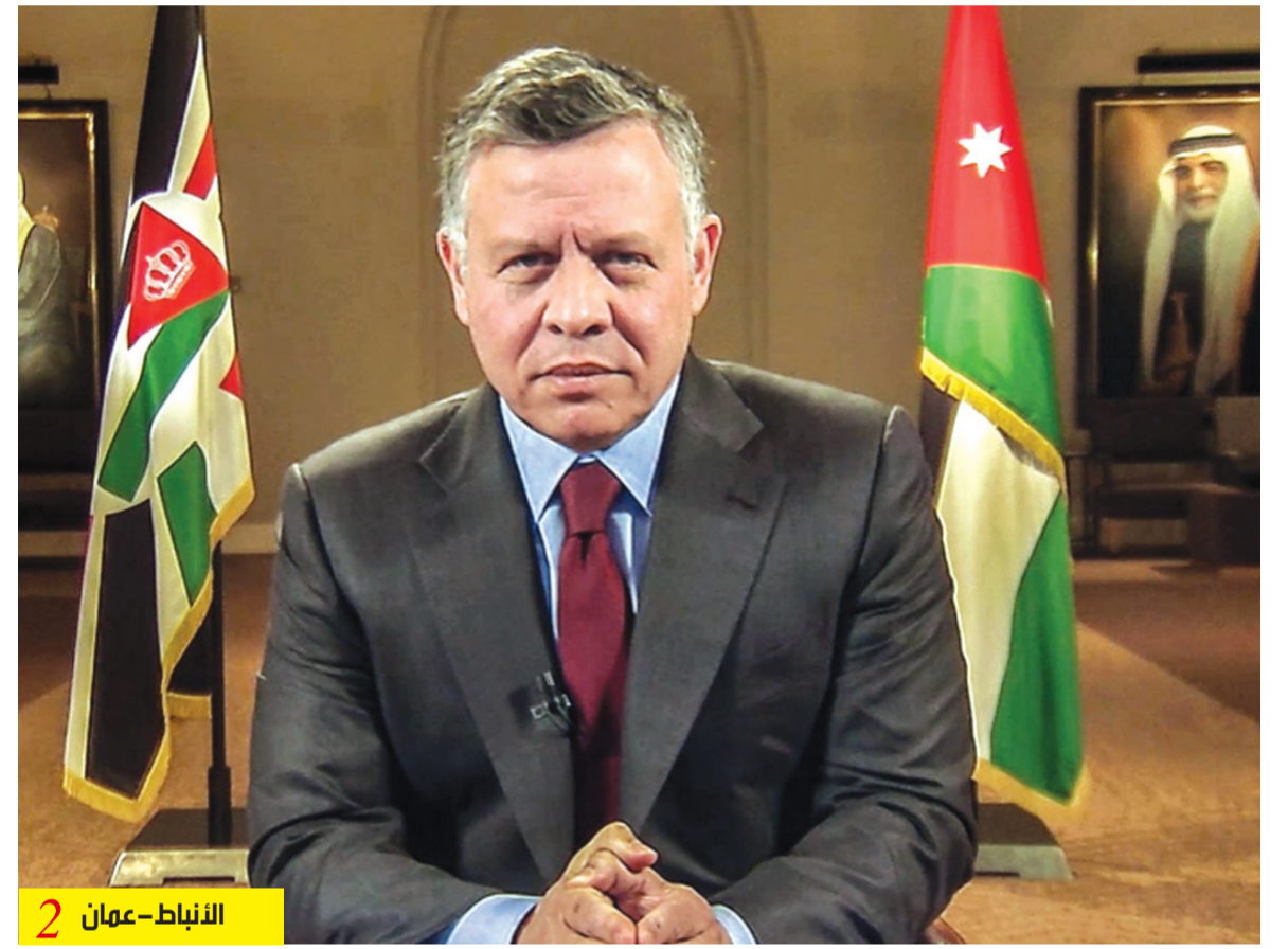
الأنباط - عمان 2

أكد في محاضرة في «العلوم التطبيقية» أن القومية العربية باقية