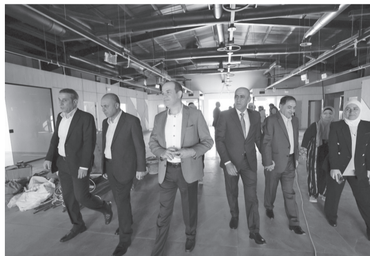
الأنباط - جرش

محورية في خارطة طريق تحديث القطاع العام التي تشكل مساراً أساسياً ضمن المسارات الثلاثة في مشروع التحديث الشامل.