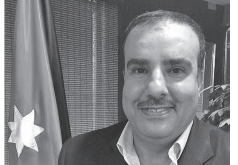
الأنباط - ززان السيد

أكثر كمية من المياه المتاحة. وأشار في حديثه لـ "الأنباط" إلى أهمية تنظيف السدود بشكل دوري، لا سيما السدود الصغيرة مثل سد الوالة، وسد الهيدان، وسد الموجب، حيث يجب أن تتم صيانتها بانتظام، قائلا: "نحن بحاجة لكل قطرة مياه". ولفت إلى أن المولدين الدوليين غالباً ما لا يعطون أولوية للسدود، مما يجعل من الصعب إقناعهم بتخصيص موارد مالية لدعم هذه المشاريع الحيوية. ودعا إلى ضرورة الاستعداد الدائم لمواجهة أي تغييرات في معدلات الهطول المطري، حيث إن ذلك ينعكس سلباً على كميات التخزين في السدود. موضحاً أن هناك أساليباً أخرى لحصاد المياه يتمثل في إنشاء آبار تجميعية في المباني الجديدة، مما يمكن من جمع مياه الأمطار من الأسطح، والتي تعتبر مياهاً نظيفة وصالحة للشرب. وأوضح أن هذه الآبار يمكن أن تجمع نحو 50 م 3 من المياه في حال هطول 500 م 3 . وحول الأهمية الاقتصادية للسدود، أشار إلى أن سد الملك طلال يروي مناطق واسعة من الوسط والشمال، ما يدعم ري نحو 400 ألف دونم من الأراضي الزراعية. وحذر من أن أي تراجع في كميات المياه أو عدم المحافظة على السدود قد يؤدي إلى هجرة السكان من المناطق الريفية إلى المدن، مما يؤثر سلباً على استمرارية الحياة في هذه المناطق. وتشير الدراسات والإحصائيات