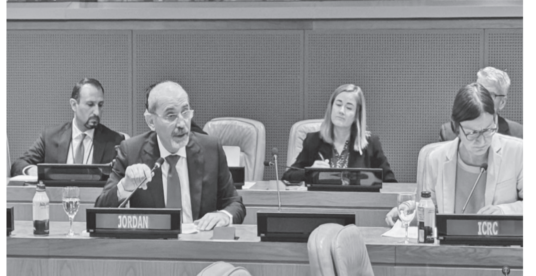
الأنباط - نيويورك