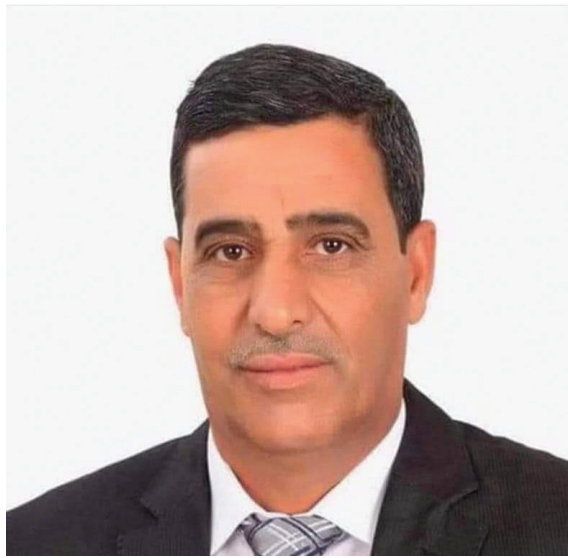
* رئيس بلدية صبا والدفيانة «عيد السردية»