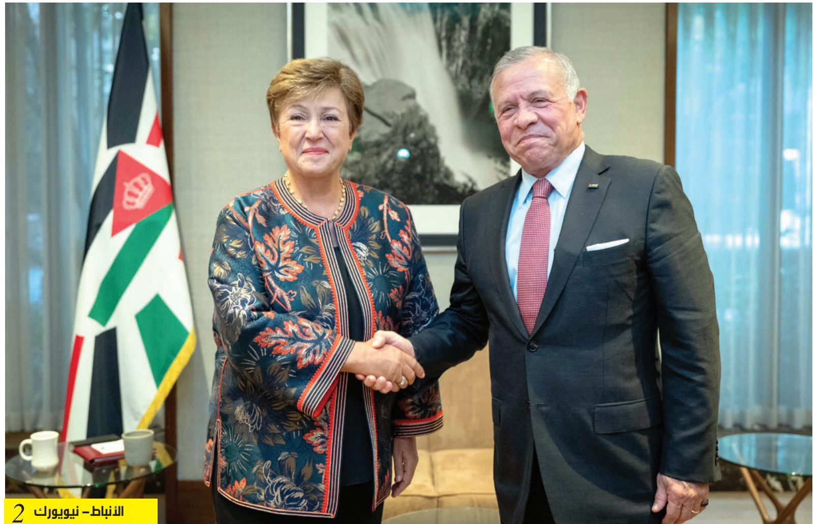
الأنباط - نيويورك 2