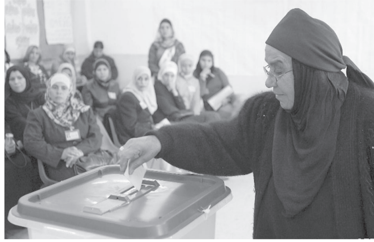
الأنباط - ألاف تيسير / داليا الزويد

لن تؤدي إلى تحسين أوضاعهن أو تحقيق تطلعاتهن. خاصة مع استمرار القضايا المتعلقة بالمساواة في المجتمع. بالمقابل وفي العديد من المحافظات النائية مثل جرش وعجلون، تكون البنية العشائرية هي العامل الحاسم في تحفيز الناس على المشاركة في الانتخابات. في وقت يعتمد فيه الناخبون في هذه المناطق بشكل كبير على الولاءات العشائرية والتصويت لصالح مرشحين يمثلون العشيرة أو العائلة الكبيرة، وهذا النظام التقليدي يعزز من النفوذ العشائري في البرلمان، ولكنه في الوقت نفسه يعيق النساء من المشاركة الفعالة في العملية السياسية بسبب القيود الاجتماعية المفروضة