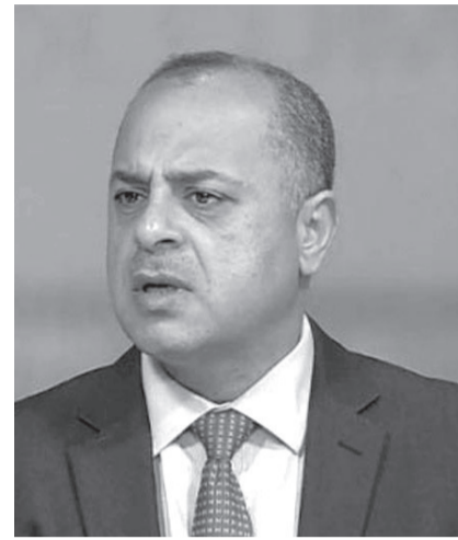
■ أبو صعيك

الإمارات من أبرز المستثمرين الدوليين بالأردن