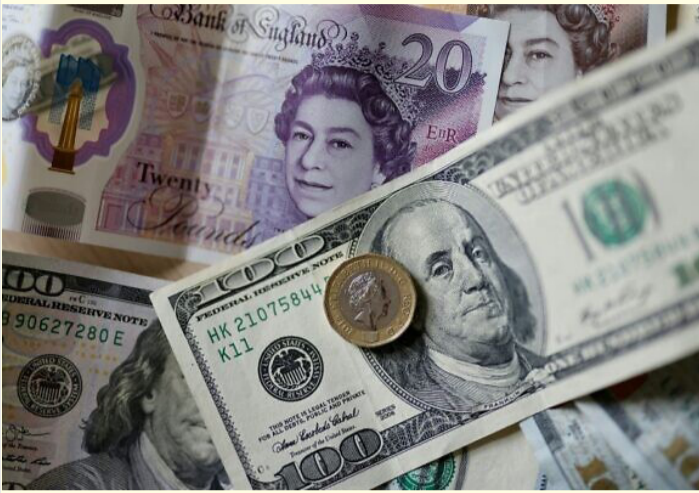
الأنباط - وكالات

ووفقاً لتقارير من مراكز المال لبريطانية، صعد الاسترليني اليوم، بنسبة ٠.١٩ بالمئة أمام الدولار ليصل عند مستوى ١.٣١٦٩ دولار، بينما انخفض بنسبة ٠.٣٣ بالمئة مقابل (اليورو) ليصل عند ١.١٨٦٤ يورو.