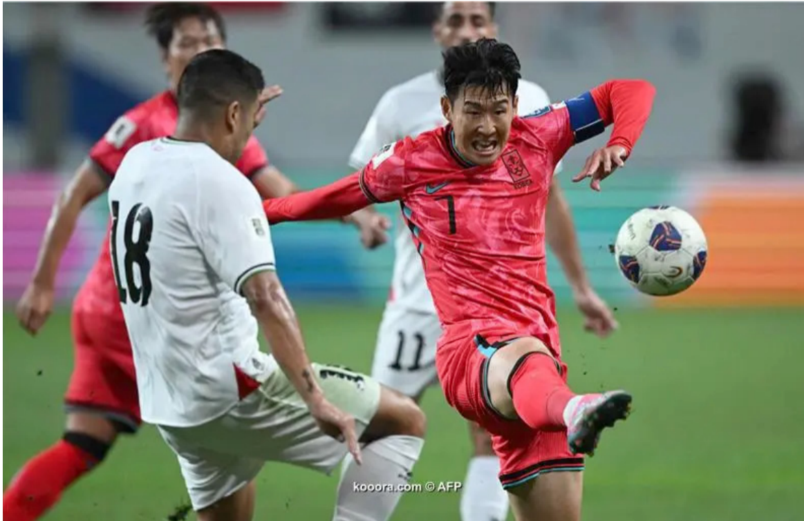
سيؤول - وكالات

خيم التعادل السليبي على مباراة منتخب كوريا الجنوبية مع ضيفه منتخب فلسطين الخميس على استاد سول ضمن الجولة الأولى من منافسات المجموعة الثانية في الدور الثالث من التصفيات الآسيوية المؤهلة إلى كأس العالم 2026 في أمريكا وكندا والمكسيك. وتضم المجموعة أيضاً منتخبات الكويت والعراق وعمان بخلاف الأردن وكوريا الجنوبية. وأمضى المنتخب الفلسطيني (الضدائي) عدة أيام في كوالالمبور استعداداً لمواجهة كوريا الجنوبية، وسيعود إلى العاصمة الماليزية من جديد لخوض مباراة الثلاثاء المقبل ضد الأردن ضمن الجولة الثانية. تجدر الإشارة إلى أن «الضدائي» حمل نتائج سلبية في مشواره التاريخي في لقاءاته السابقة أمام منتخبات شرق آسيا في ملاعبها، حيث واجه منتخبات الصين، وفيتنام، واندونيسيا، في ثمانية