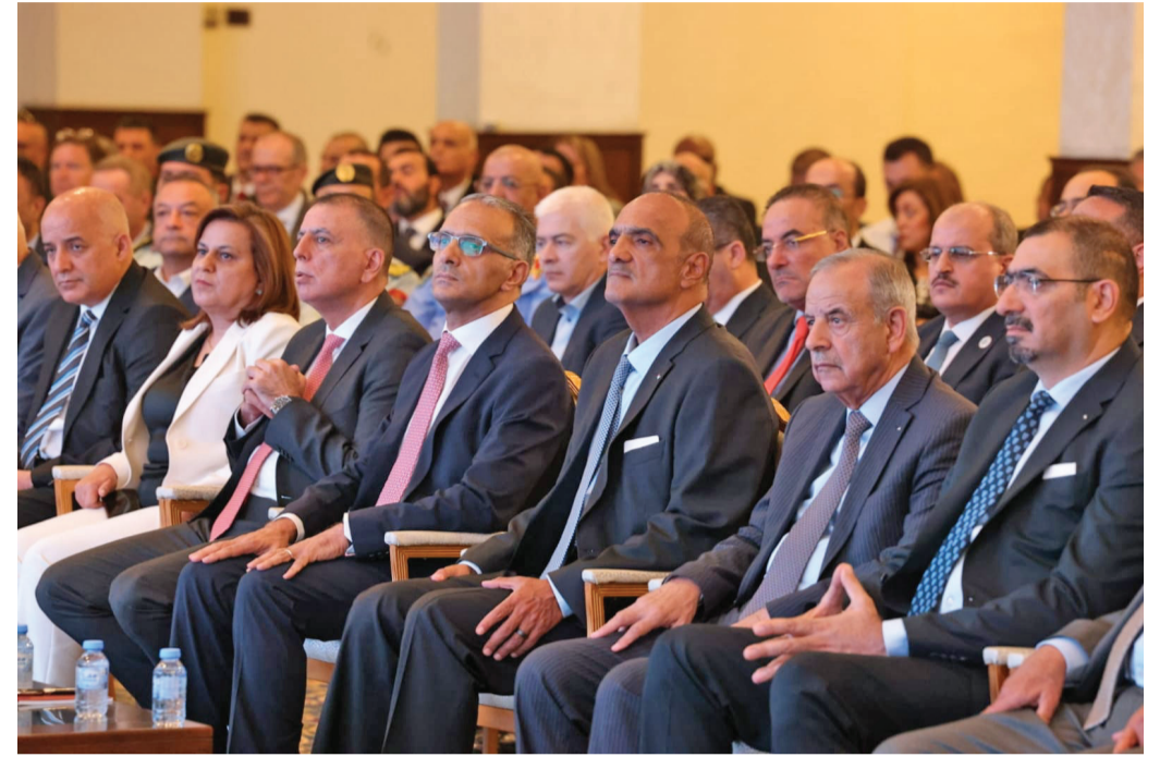
الأنياب - عمان

الخطة تستند إلى توظيف التكنولوجيا والعنصر البشري الكفؤ، وتتضمن ٥ أهداف استراتيجية يندرج تحتها ١٩ محوراً.