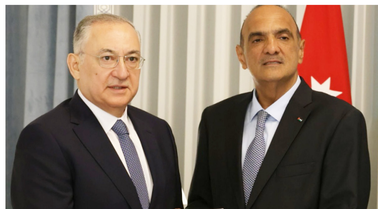
منظومة النزاهة والشفافية، وتأهيل الطواقم

وأشار حجازي إلى وجود مركز تدريب مخصص لتوعية والتثقيف، إضافة إلى عقد شركات مع هيئات ومؤسسات وطنية من أجل تعزيز قيم النزاهة والشفافية وضمان سيادة